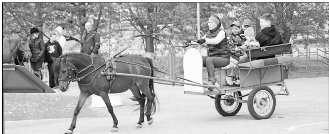
☞ Один из детских аттракционов – катание на пони. Дети в восторге!