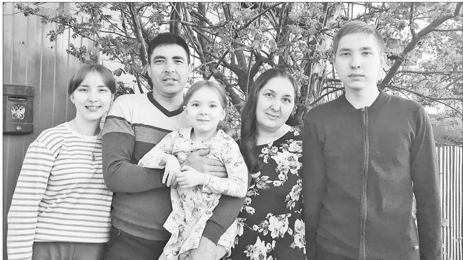
■ Удачная сдача главой семейства экзаменов и возвращение с учёбы – прекрасный повод для совместного семейного снимка.