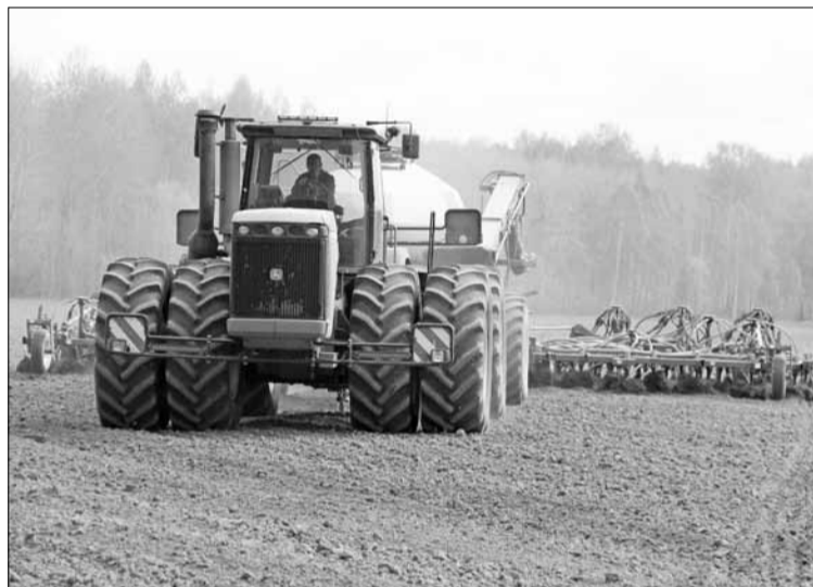
■ В АП «Продукт» идёт сев пшеницы сорта «икар».

уходить на два и более метра в глубину. Остальные сорняки будут уничтожаться прямо в культурах.