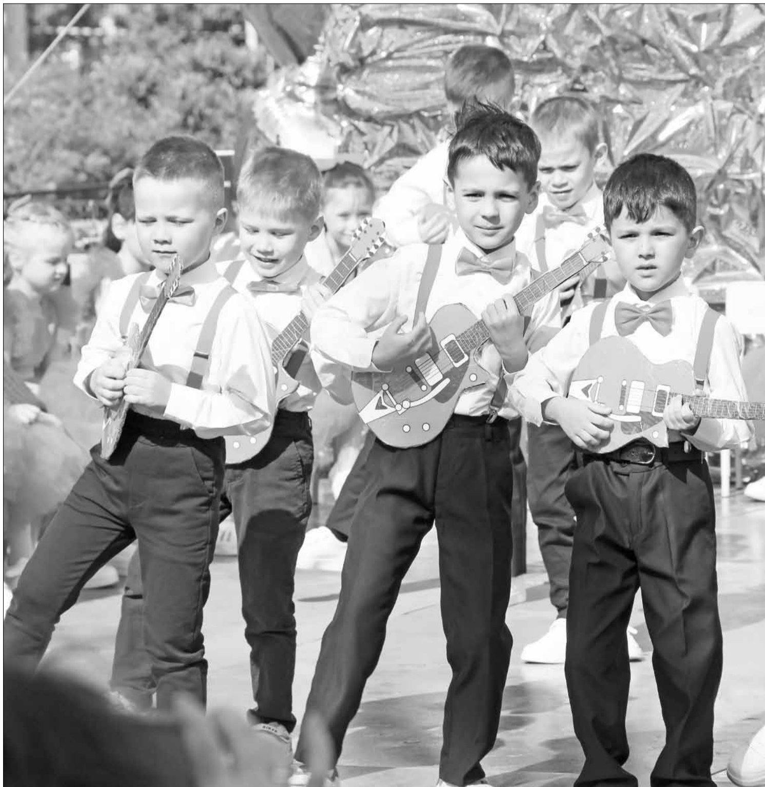
☑️ Мальчишки зажгли не хуже профессиональных гитаристов.

Большая благодарность всем работникам детских садов, каждый день с любовью принимающим наших ребят! Много удивительных открытий, новых знакомств, отличной учёбы будущим первоклассникам! И, конечно, безграничного терпения и сил их родителям!