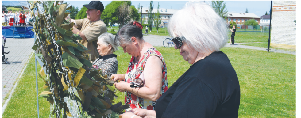
Жители Приисетья плетут маскировочные сети.

80 лет назад, когда Тюменская область только появилась на карте СССР, численность населения в Исетском районе, по данным на 1 февраля 1944 года, была 21 865 человек.