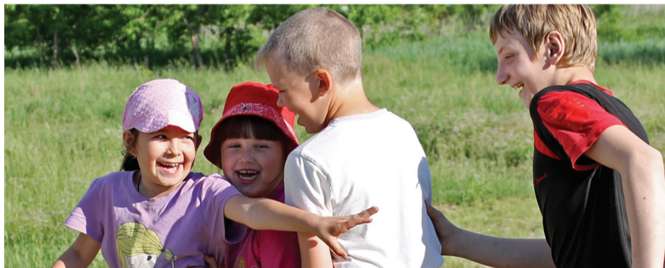
Для отдыха детей устанавливаются игровые площадки. Летом досуг юных исетцев и гостей района разнообразят работники культуры, организовывая игры и состязания, викторины и квесты.