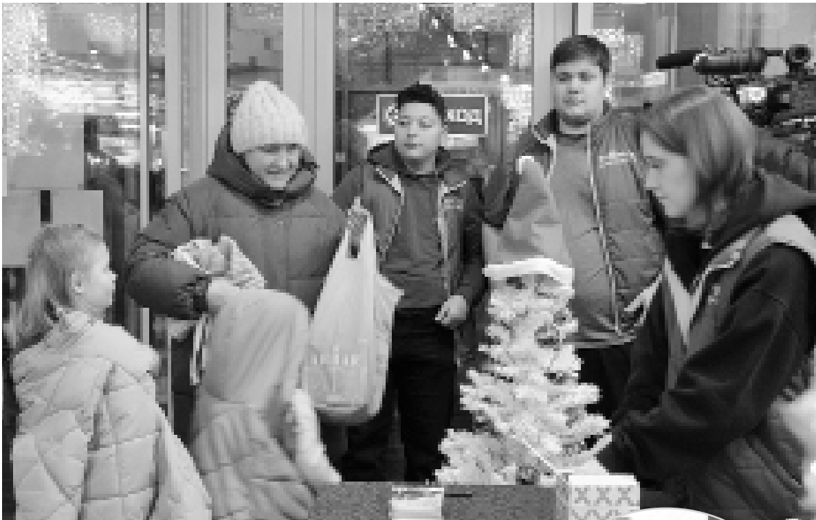
► К волонтерам в «Жемчужине Сибири» выстраивались очереди

Волонтеры вручали каждому благотворителю стикер с эмблемой акции «Код добра». По окончании акции ребятам ещё предстояло упаковать коробки с новогодней «гуманитаркой». Все коробки будут переданы в городской совет ветеранов, который уже давно считается в Тобольске главным штабом по сбору и отправке гуманитарной помощи нашим бойцам на СВО, и уедут в зону СВО с очередным гуманитарным грузом в 20-х числах