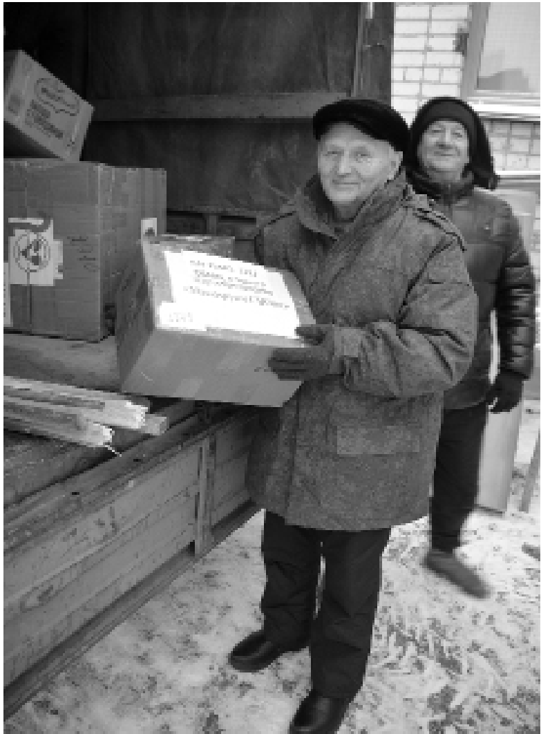
► Владимир Габрусъ / Фото автора

Новогодний гуманитарный груз будет доставлен на одной машине, предоставленной вместе с водителями Тобольским ПАТП. Общий вес груза – 3 тонны. Кроме новогодних подарков, в семь воинских частей, дислоци-