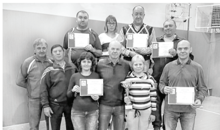
Победители и призёры спартакиады.

В рамках общекомандной борьбы, набрав по 35 баллов, в самом верш турнирной таблицы расположились два коллектива – представители органов местного самоуправления – команда «Администрация» и команда с большим соревновательным опытом «Ветераны 50+». Судьба первого места решилась лишь по