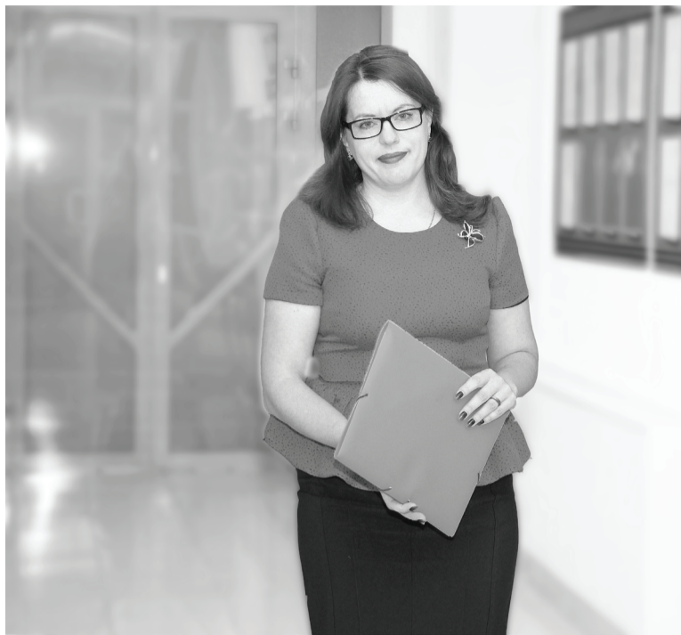
Дипломированный специалист с опытом работы востребован на нашей земле.

В Россию наша соотечественница переехала из Казахстана