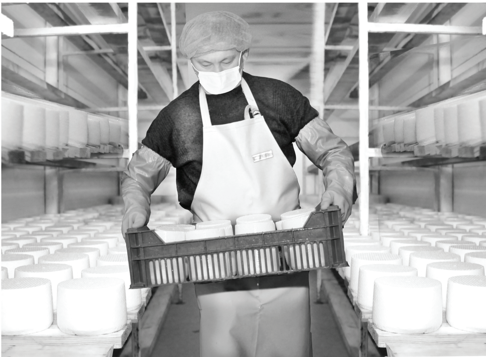
Сыровары производят несколько сортов продукции.

Александр МООР, Губернатор Тюменской области