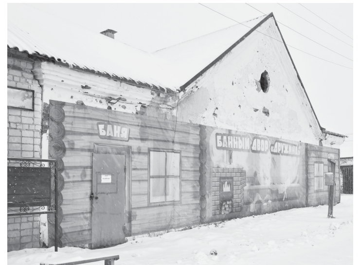
Баню в Ярково в ближайшем будущем ждет переход на газ