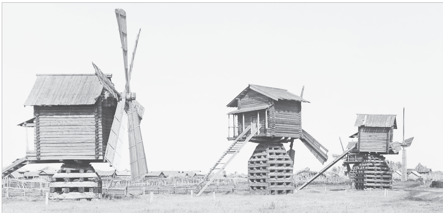
«Столбовые мельницы в Ялуторовском уезде». 1912 год

10-12 км, он пролегал от Киёво, минуя Беркут, на Романово, Зиново, Памятнинскую и официально был открыт в 1838 году.