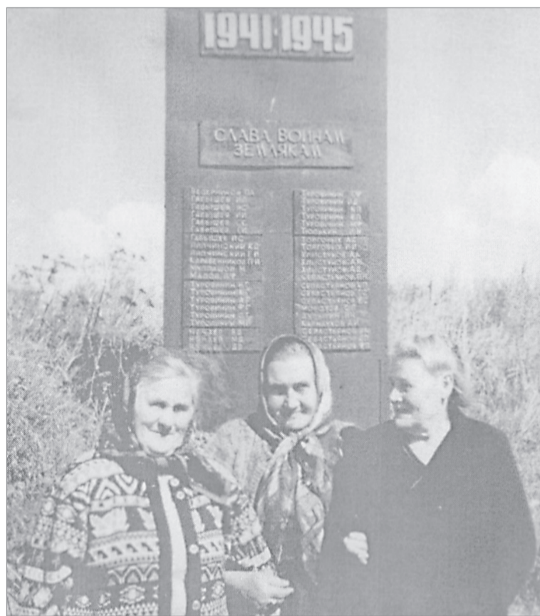
Не забыли деревню и тех, кто воевал

Деревня к этому дню преображалась: дворы подметались, хозяйки наводили порядок в домах, готовили вкусное угощение (а это, к слову, должна была быть в основном курятина).