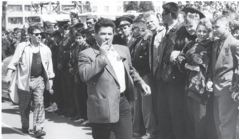
В 1995 году для тоболяков выступал Николай Расторгуев.

Попробовать себя в роли экологов можно будет в роше Журавского, мини-лаборатория будет работать с 12.00 до 17.30 часов.