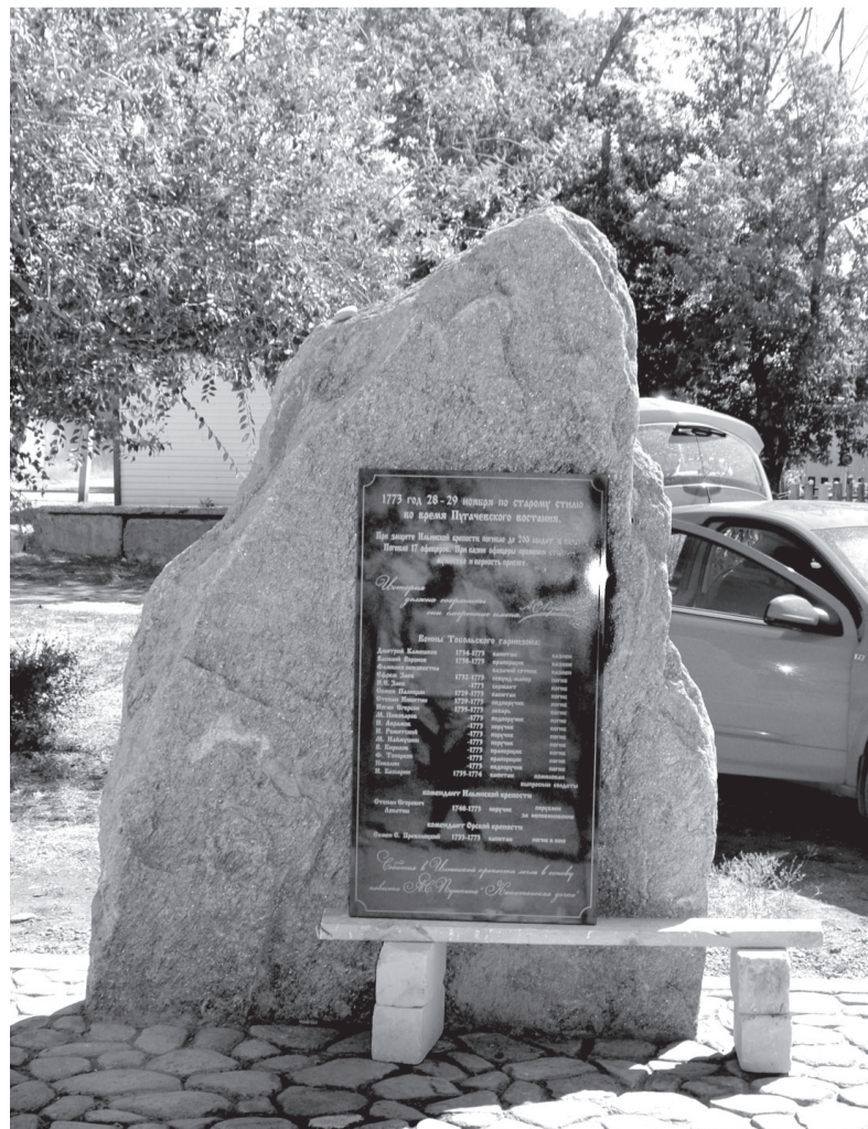
Памятник в Ильинском. Эти имена тоболяков увековечены и Пушкиными