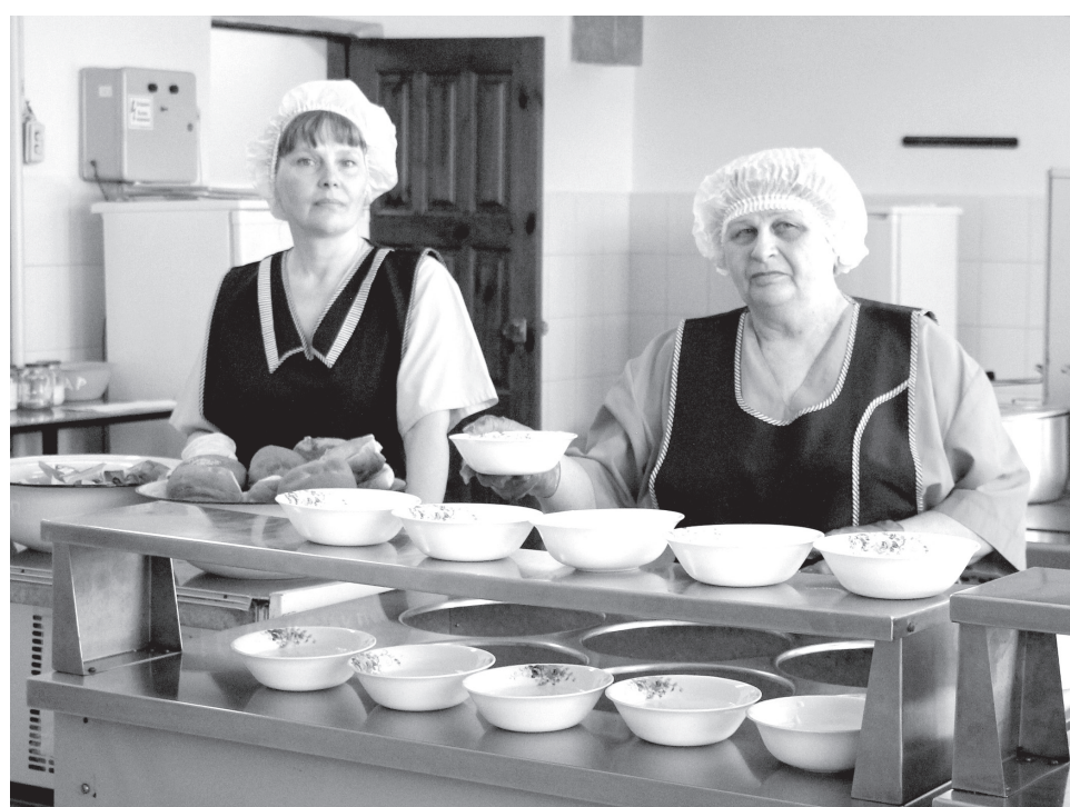
Повара готовят такие блюда, что пальчики оближешь.