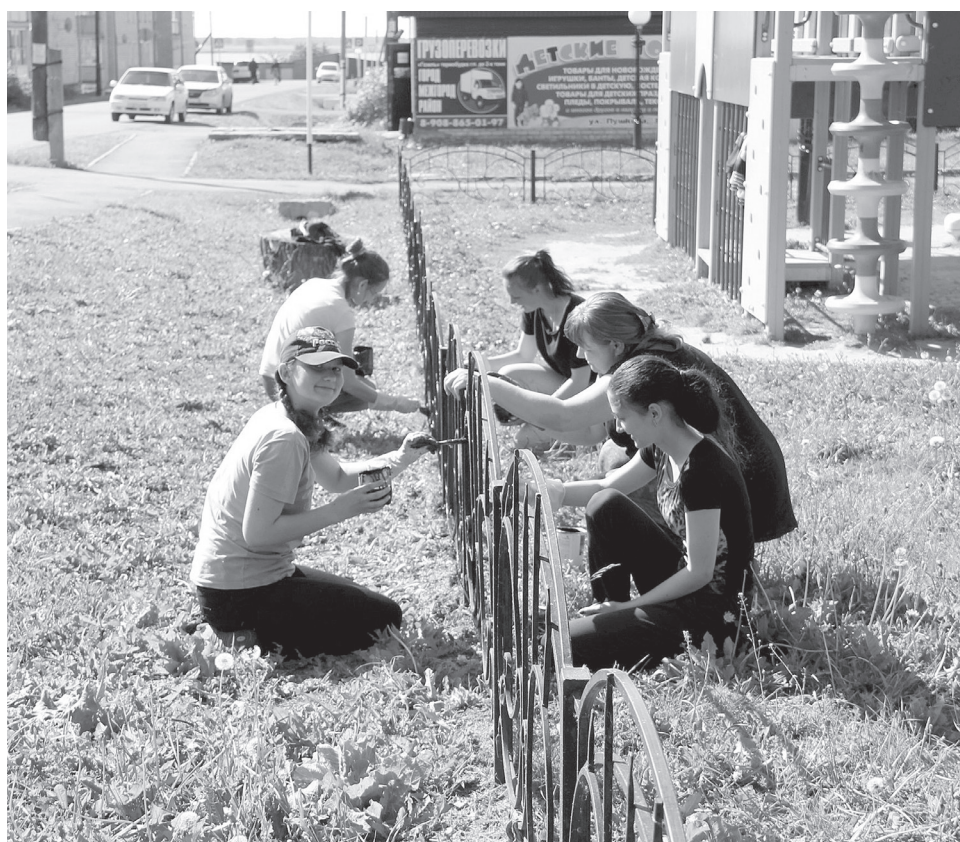
В летнее время у сладковских ребят есть возможность хорошо отдохнуть и поработать в организациях и учреждениях нашего района.

На протяжении последних пяти лет количество проходящих оздоровление в лагерях дневного пребывания детей не снижается. В 2023 году в течение лета