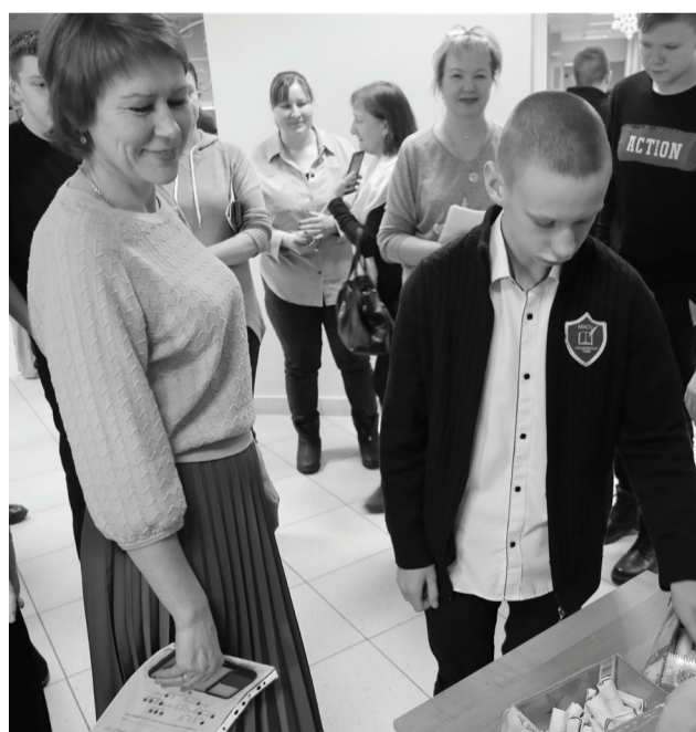
Родители смогли поближе познакомиться с образовательным процессом, меню школьной столовой, получить консультацию педагога-психолога и с пользой провести время с детьми.