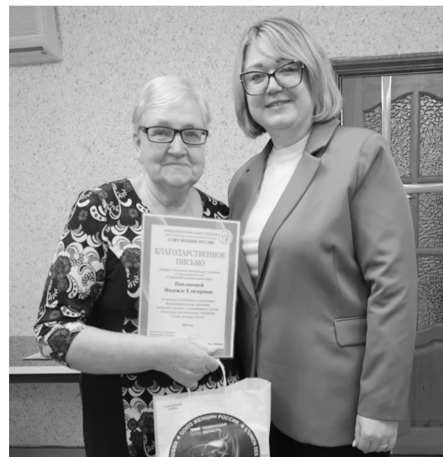
«Серебряные» волонтеры получили заслуженные награды.

За чашечкой чая сладковские добровольцы обсудили итоги уходящего 2024 года и наметили планы на 2025-й. А для того, чтобы поднять новогоднее настроение, встречу завершили художественной самодеятельностью.