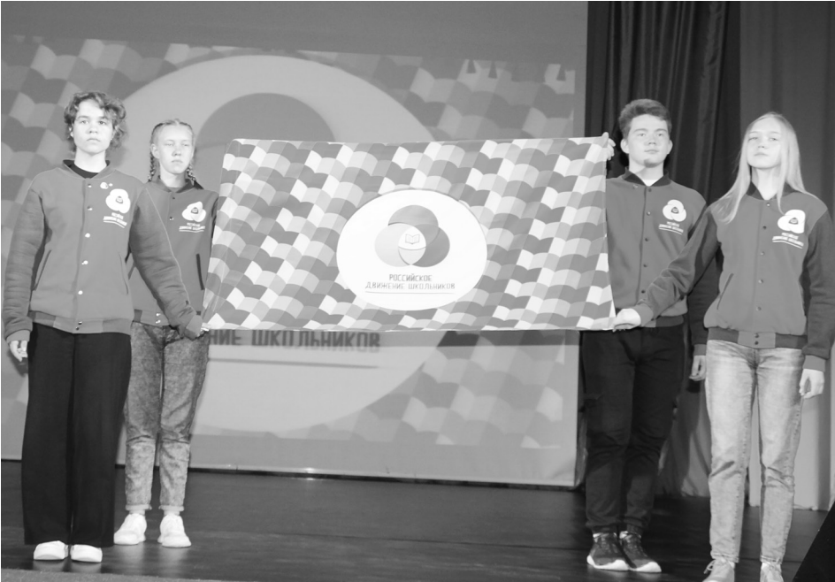
Активисты Российского движения школьников с трепетом относятся к своему флагу.

стижения не могли бы воплотиться в жизнь, так что низкий поклон тем людям, которые воспитывают нашу молодёжь.