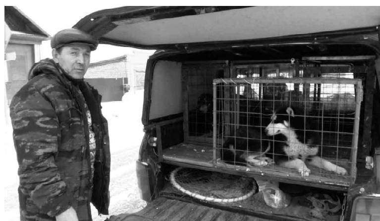
Администрацией района организована работа по отлову бродячих животных

На улицах нашего села бродячие собаки недружелюбным поведением пугают не только ребятшек, но и взрослых. Более агрессивные и голодные псы свободно-выгульного содержания стали появляться в лесах и истреблять там, в частности, косуль, которые с трудом переносят нынешнюю зиму и страдают от бескормицы.