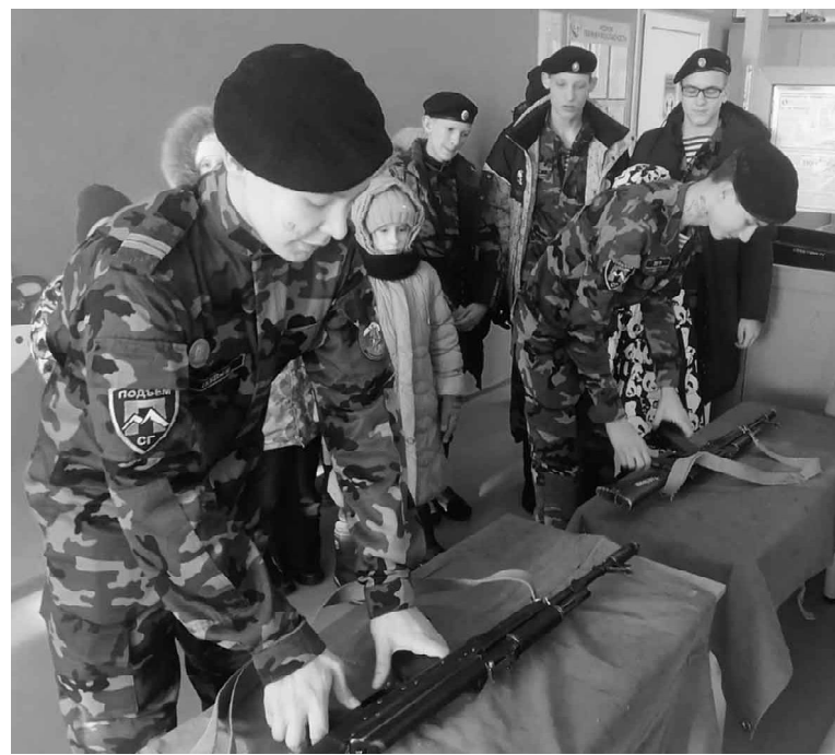
Проходит конкурс по сборке-разборке автомата