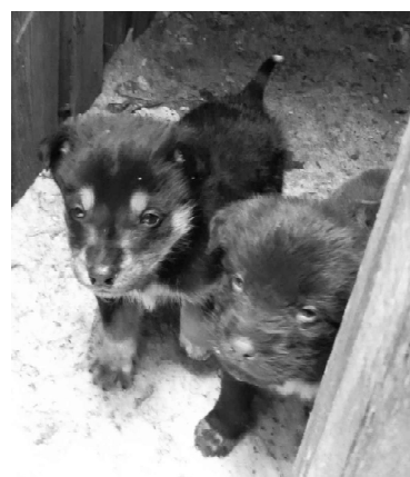
Вот эти симпатичные щенки могут пополнить свору бездомных собак, которые будут разгуливать по селу