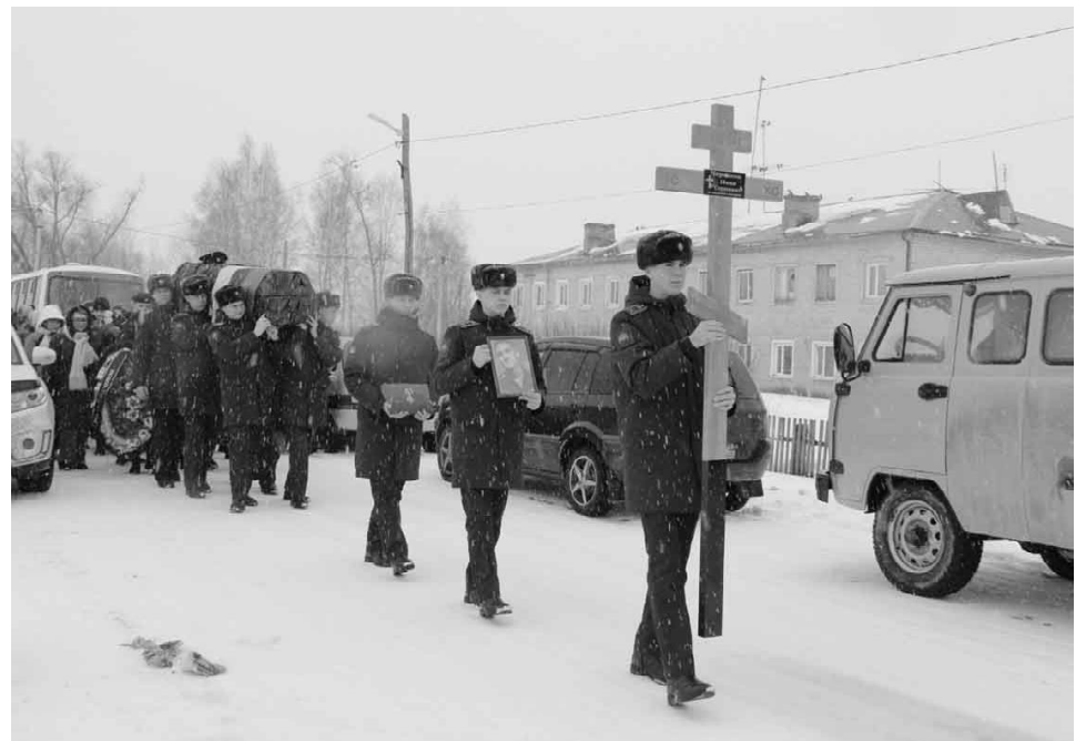
Воина-земляка похоронили на Зимовском кладбище