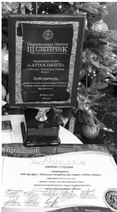
Награды уехали в Тобольск

Национальная телевизионная премия в области хореографического искусства «Щелкунчик» учреждена Международной академией хореографии ЮНЕСКО совместно с Министерством культуры России и российским федеральным телеканалом «Общественное телевидение России». Престижный танцевальный конкурс проходит ежегодно в период Рождественских каникул в Москве. В 2026 году премия прошла с 10 по 13 января в Большом концертном зале «Москва».