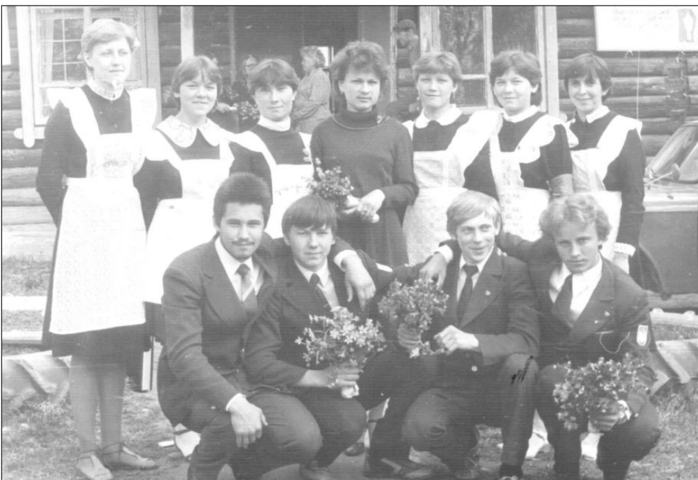
Учащиеся школы, 1980 г.