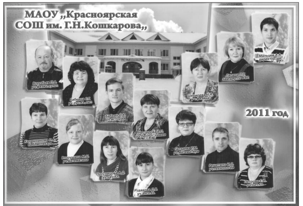
Педагогический коллектив, 2011 г.