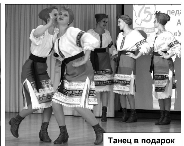
Танец в подарок