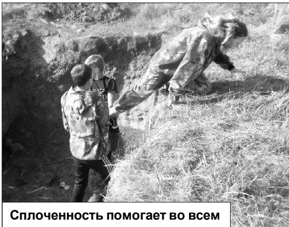
Сплоченность помогает во всем