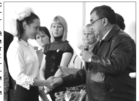
Глава поселения вручает награды

Мне удалось поговорить с выпускниками и узнать — каким видят своё будущее. Девушки и юноши оказались веселыми, дружелюбными и охотно поделились планами. Почти все уже определились с выбором профессии: одни мечтают стать учителями физической культуры, другие видят себя только в медицине, кто-то хотел бы освоить таможенное дело... В об-