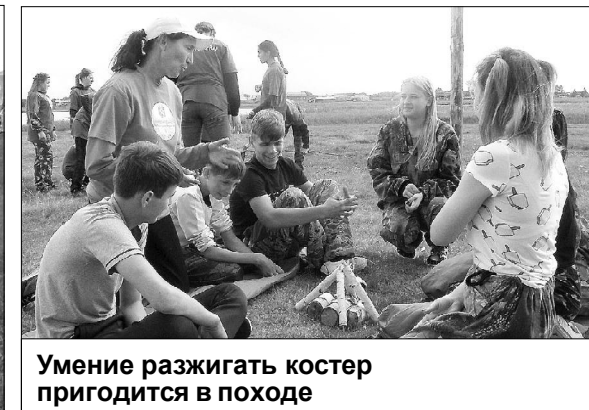
Умение разжигать костер пригодится в походе