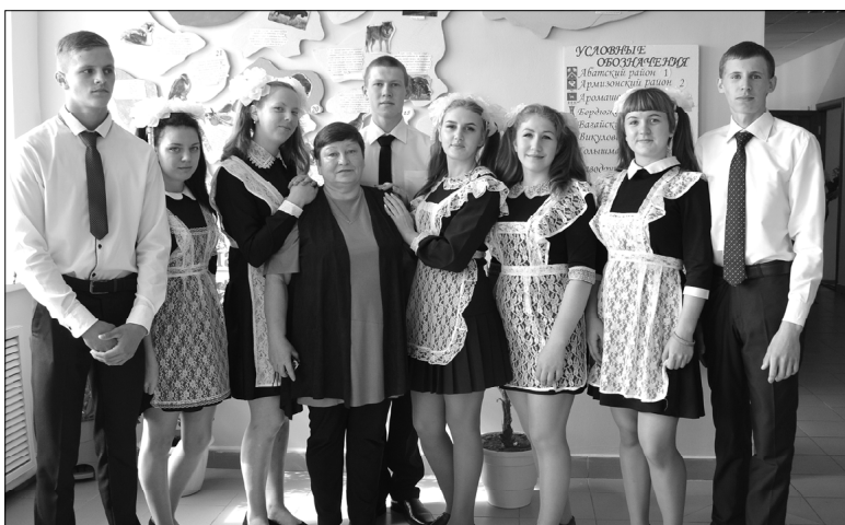
Однадцатиклассники со своим учителем