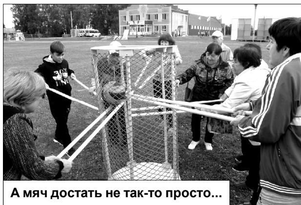
А мяч достать не так-то просто...