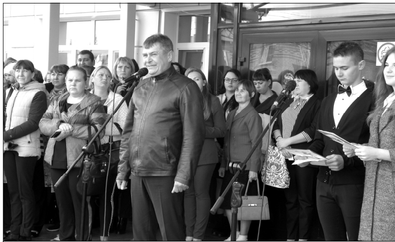
Глава района поздравляет с Днем знаний

Не забыли на линейке предоставить слово и самим перво-