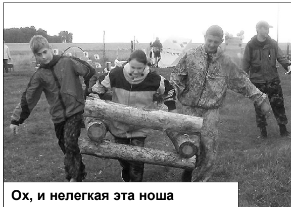
Ох, и нелегкая эта ноша