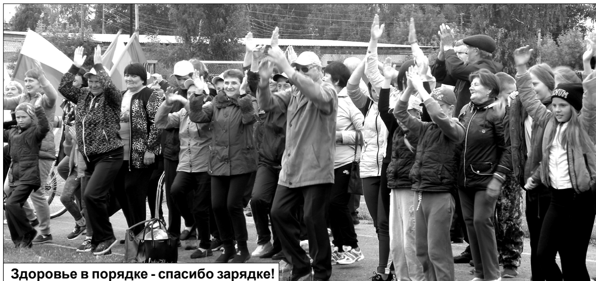
Здоровье в порядке - спасибо зарядке!