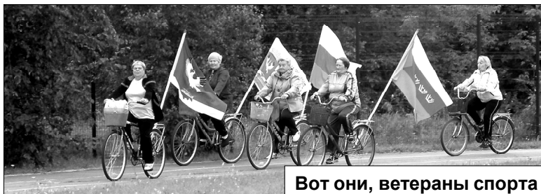
Вот они, ветераны спорта

Без меня такое мероприятие не состоялось бы! – смеется