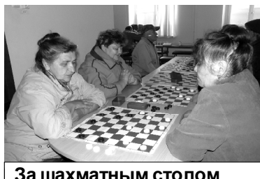
За шахматным столом