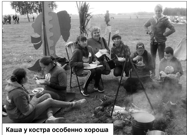
Каша у костра особенно хороша