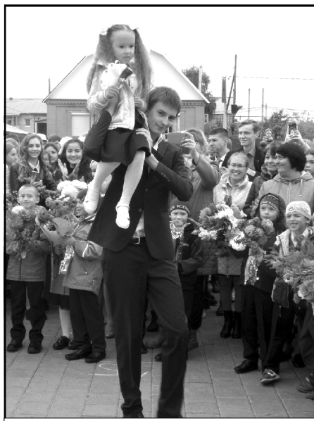
Первый звонок на урок