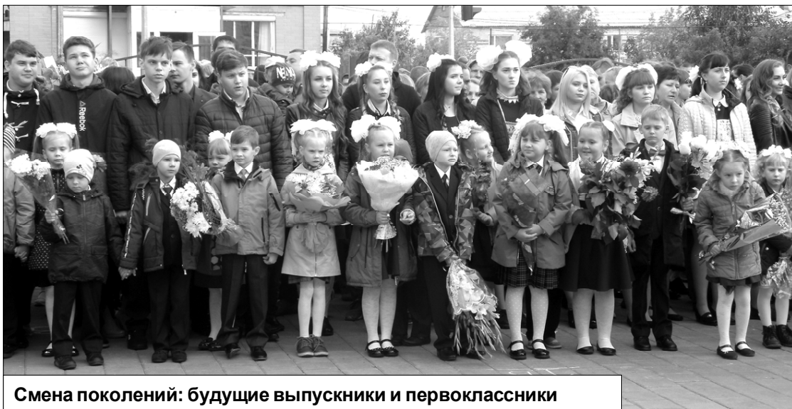
Смена поколений: будущие выпускники и первоклассники