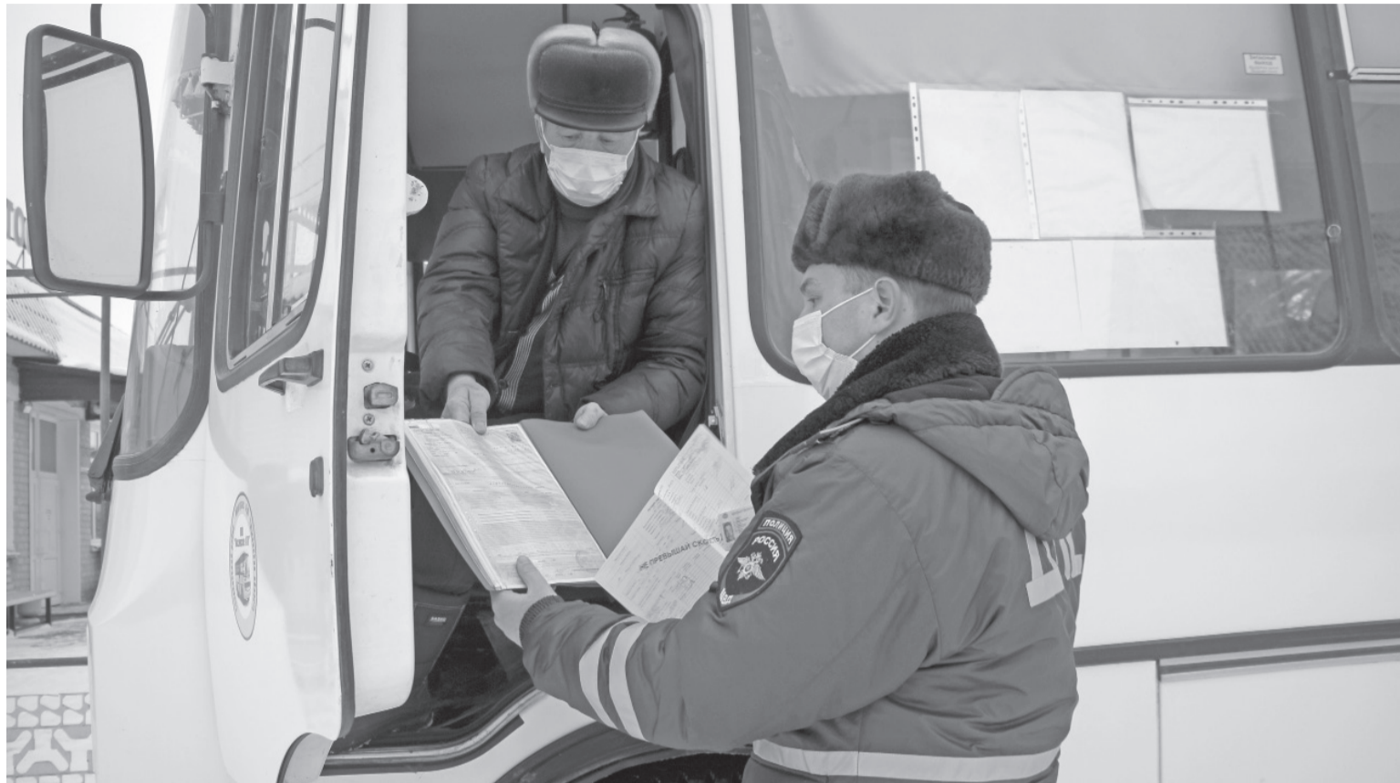
Госавтоинспекторы проверяют наличие необходимых документов у водителей автобусов.

Администрация Сладковского муниципального района