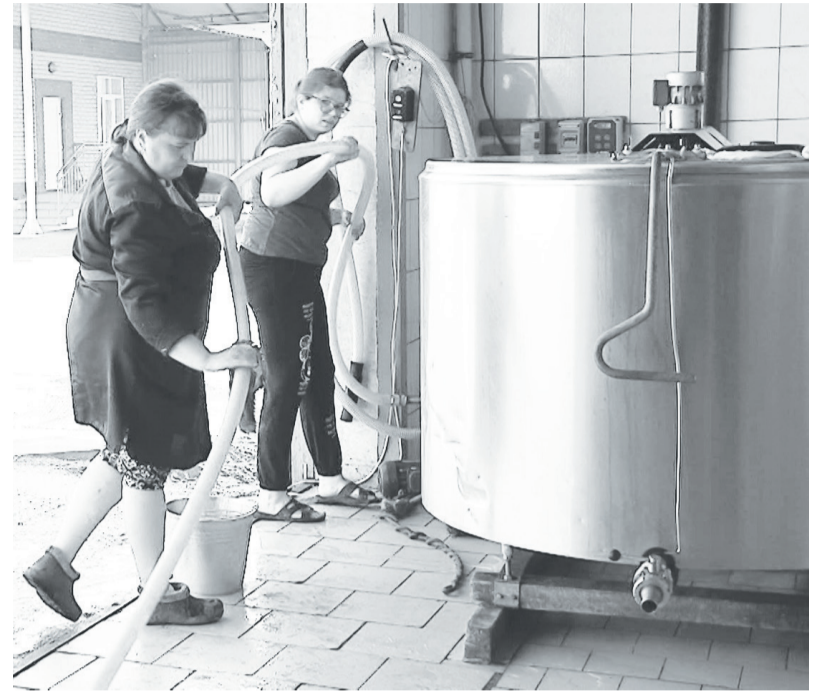
После отправки сырья на перерабатывающий завод работницы молочной лаборатории натирают до блеска танки-охладители и другое оборудование молокоприёмного пункта.

Этой осенью животноводы СПК «Емуртлинский» сдают до 35 тонн молока в сутки. И все пробы партий продукции с мегафермы, из Бердюгинского, Октябрьского и Слободчиковского отделений проходят через руки специалистов лаборатории. Работая без выходных, они контролируют качество сырья, отправляемого в переработку, составляют сопроводительные документы на партии.