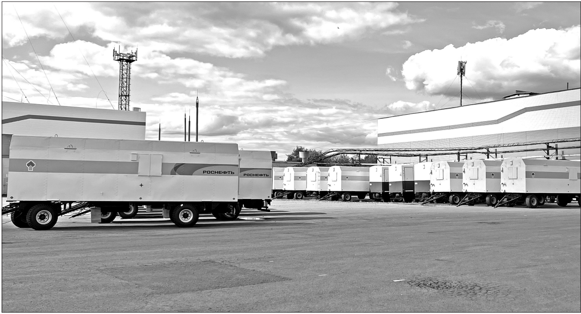
Не один десяток лет Заводоуковский машиностроительный завод тесно сотрудничает с нефтяными компаниями страны. Предприятие поставляет на буровые мобильные вагоны-дома «Кедр», которые являются основной продукцией, выпускаемой заводчанами.

Хорошая производственная база, парк оборудования и техники, современные технологии во многом способствуют тому, что мы имеем сейчас. Но любые достижения вряд ли были бы возможными без наших работ-