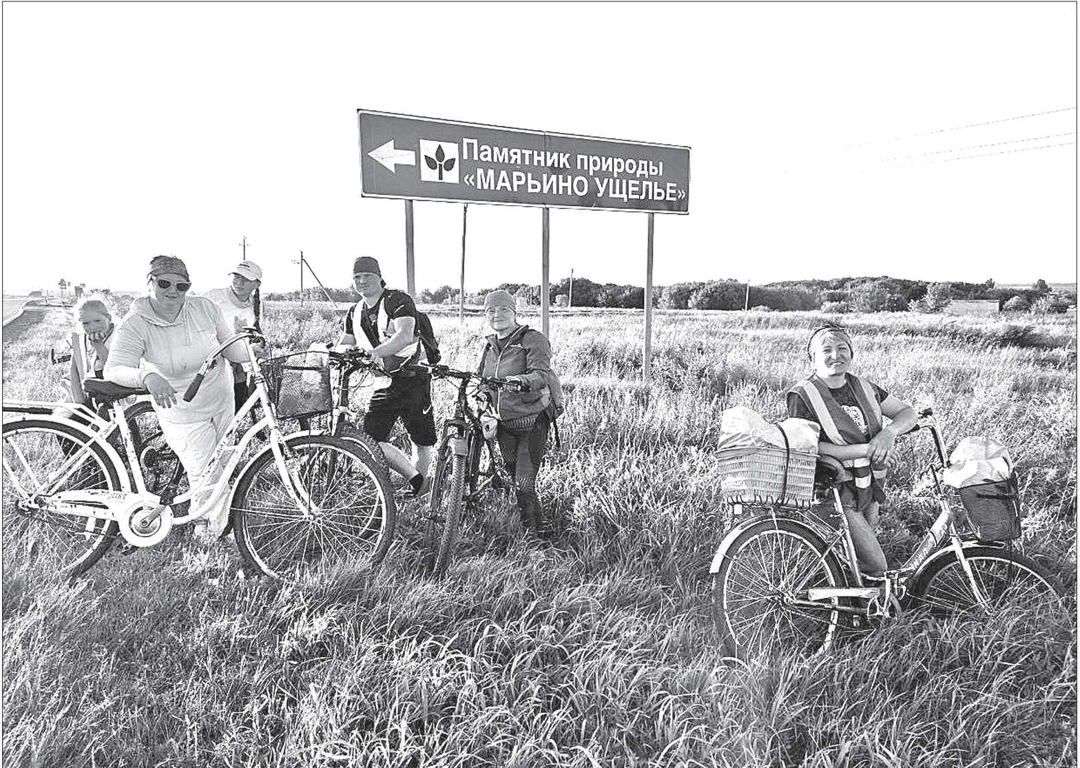
Заводоуковские велотуристы проехали десятки километров, чтобы полюбоваться природной достопримечательностью – Марьиным ущельем.