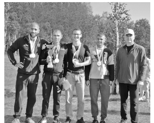
У «Зурбагана» из Бердюжья – «золото» среди мужских команд

– Экстремальный забег в Больших Чирках организован на хорошем уровне, бывала в Армизонском районе, где соревнования проходят примерно так же. Нам, конечно, не сравниться с городами. Радует, что участников стано-