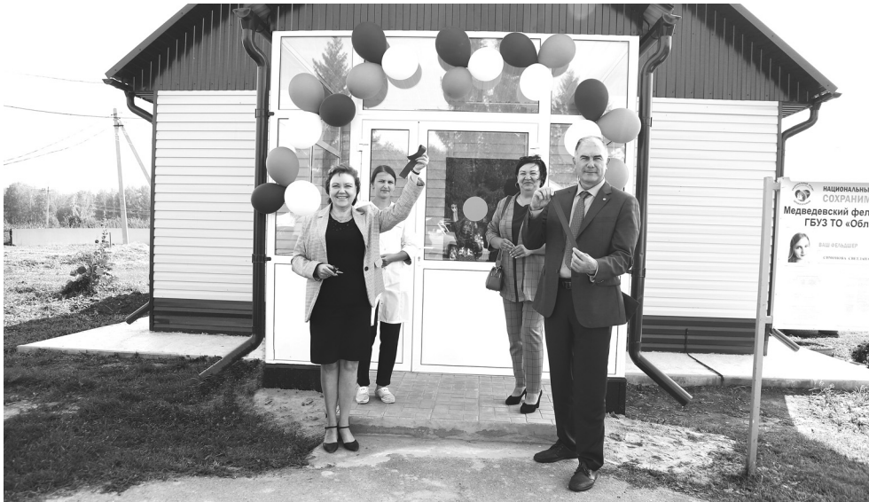
Преобразившийся после капитального ремонта ФАП в Медведево стал украшением села

В Медведево торжественно открыли фельдшерско-акушерский пункт после капитального ремонта. Затраты взял на себя муниципалитет – здание в его собственности. На улучшение условий медицинского обслуживания населения израсходовали 3,5 миллиона рублей.