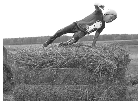
Когда мчишься к победе – для тебя нет преград

– На ваши соревнования приезжаю уже третий раз, организация всегда на высшем уровне. Дружественная атмосфера, один год даже собирали смешанную команду из Голышмановского округа и нашего района. Трасса, конечно, не простая. Без подготовки пройти её можно, но это точно не для призового места. Если хотите победить – тренировки обязательны.