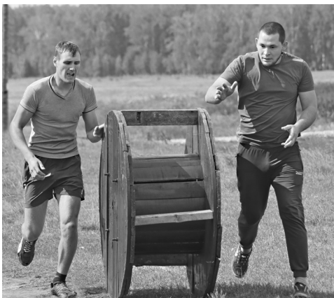
Контроль и точность движений на этапе с катушкой

Однажды сама бежала в «Голышмановском характере». Как спортсменка, я понимаю, что нет круче ощущения, чем то, когда смог преодолеть себя в сложных состязаниях. В этот раз была болельщицей, заодно общалась с участниками по работе.