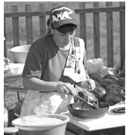
Волонтёры готовили оладьи, блины и уху – угощали вкусностями всех желающих после забега

Яна ТЕРЁХИНА