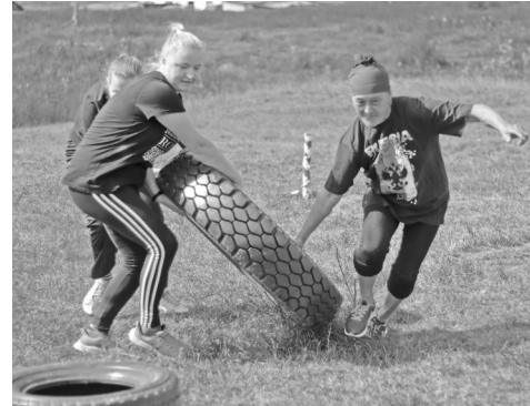
Земляновской команде всё по силам

Бердюжские парни побежали к стогам сена, впереди их ждали ещё пятнадцать испытаний. Перед финишем самое сложное – брод: участникам предстояло пересечь реку, пройти по мелководью и подняться на обрывистый берег. По окончании забега оказалось, что именно бердюжский «Зурбаган» забрал «золото» среди мужских команд.