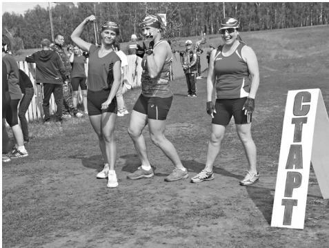
Сборная команда из Аромашево и Голышманово «Три леди» – победитель женского забега

Съехались 20 сборных команд из Голышмановского округа, Аромашевского, Омутинского, Армизонского и Бердюжского районов. У любителей физкультуры и активного отдыха соревнования с ноткой экстрима всегда вызывают особенный интерес.