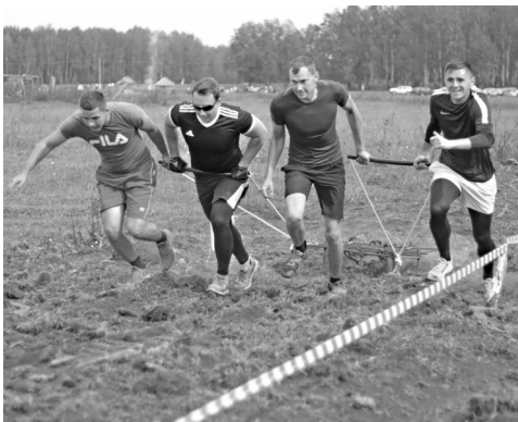
Перемещение борон – испытание для настоящих мужчин

Команды стартовали с пятиминутным интервалом. Пока очередная готовилась к выходу на дистанцию, поговорила с организатором забега – гла-