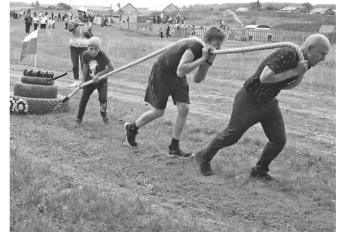
Почти стокилограммовый танк заставил всех попытеть

Среди восьми женских команд лучшее время показали «Три леди» – сбор-