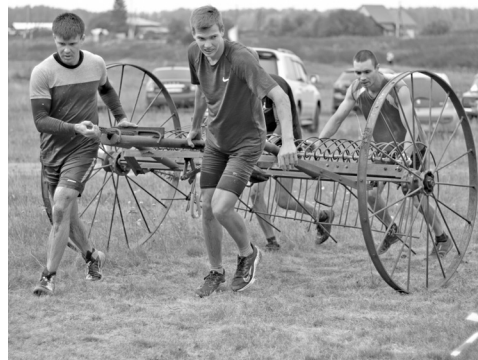
Ноша тяжела, но аромашевцы не падали духом

Глядя, как команды ловко проходят дистанцию, я решила испытать свои силы вне зачёта. Лёгким бегом преодолела по-