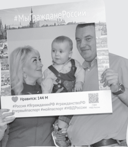
Новая российская семья

Четыре человека из Луганской и Донецкой областей Украины получили гражданство Российской Федерации в упрощённом порядке. Напомним, что в связи с изменениями в законодательстве теперь для данной категории граждан принятие российского гражданства составит не более 3 месяцев.