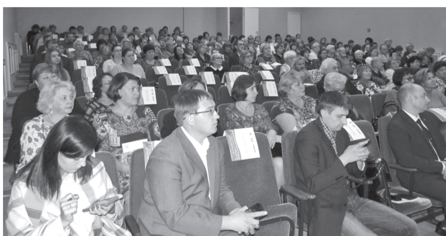
Слушали со вниманием

– С людьми надо говорить, и правильно делает руководство города, что идёт на такие шаги, – подчеркнул она.