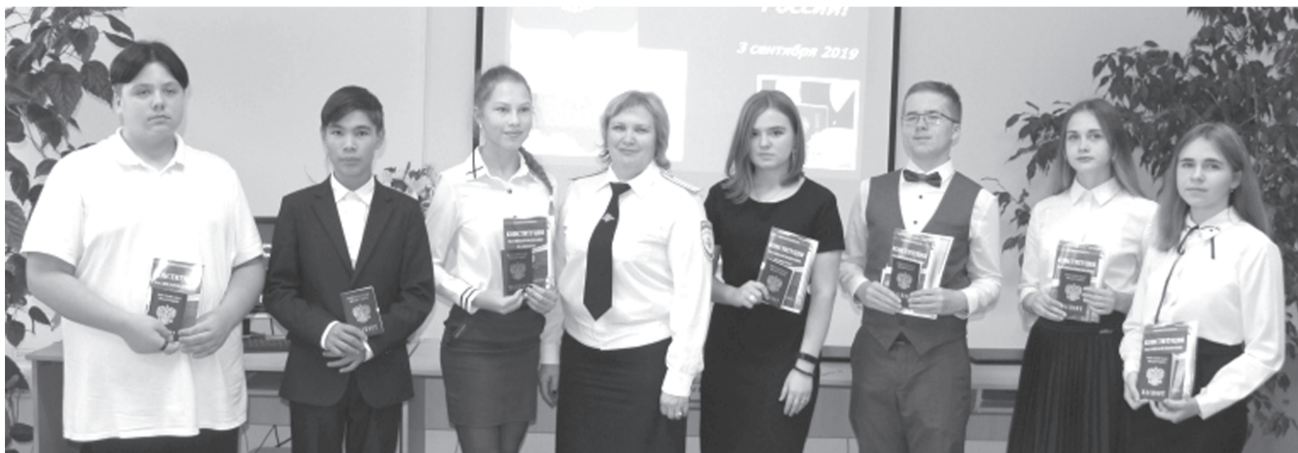
Четырнадцатилетние тобольяки получили свой главный документ в канун юбилея миграционной службы

Завтра, 11 сентября, сотрудники подразделений, отвечающие за правопрядок в миграционных вопросах, отметят 300-летие создания своей службы в системе МВД.