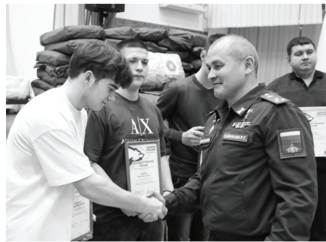
Встреча с Героем России всегда производит неизгладимое впечатление на молодежь.

сердце справилось с болевым шоком, но и быстрее восстановиться. Тренировки командир полка возобновил уже в госпитале.