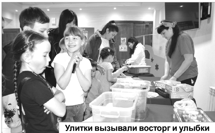
Улитки вызывали восторг и улыбки