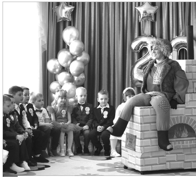
Дети учат Емелю грамотности и вежливости