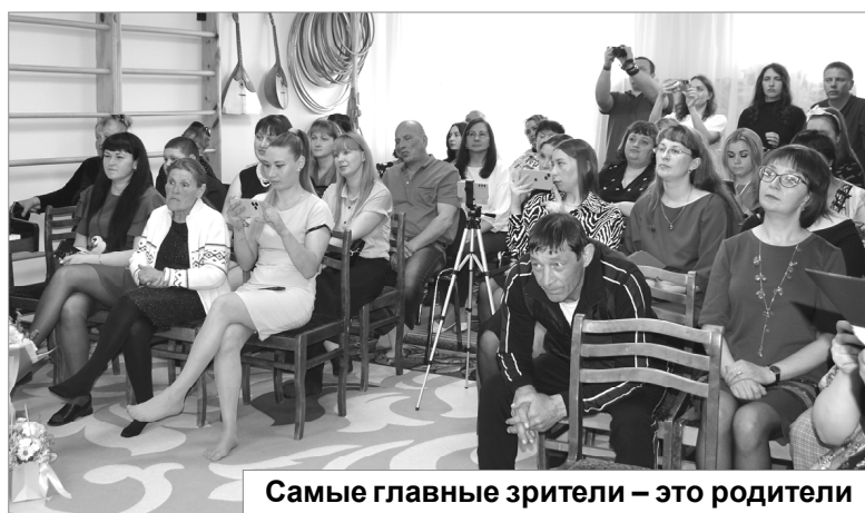
Самые главные зрители – это родители