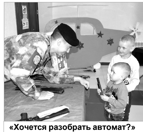
«Хочется разобрать автомат?»