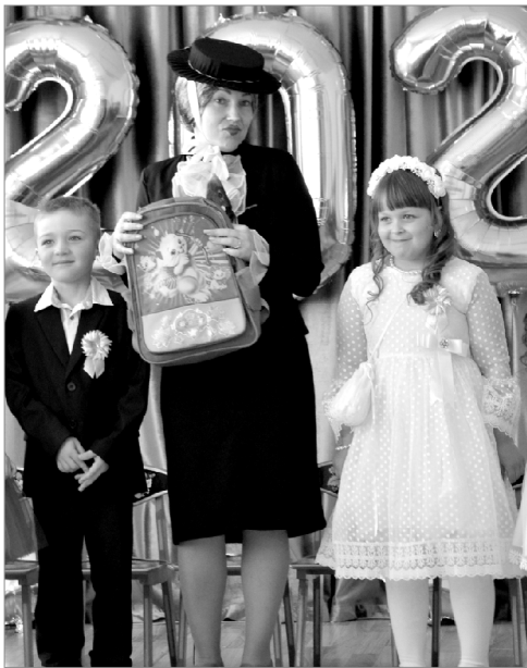
Шапокляк в гостях у дошколят