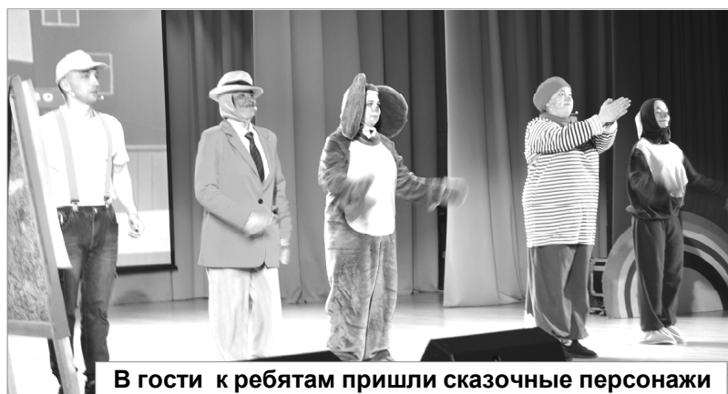
В гости к ребятам пришли сказочные персонажи