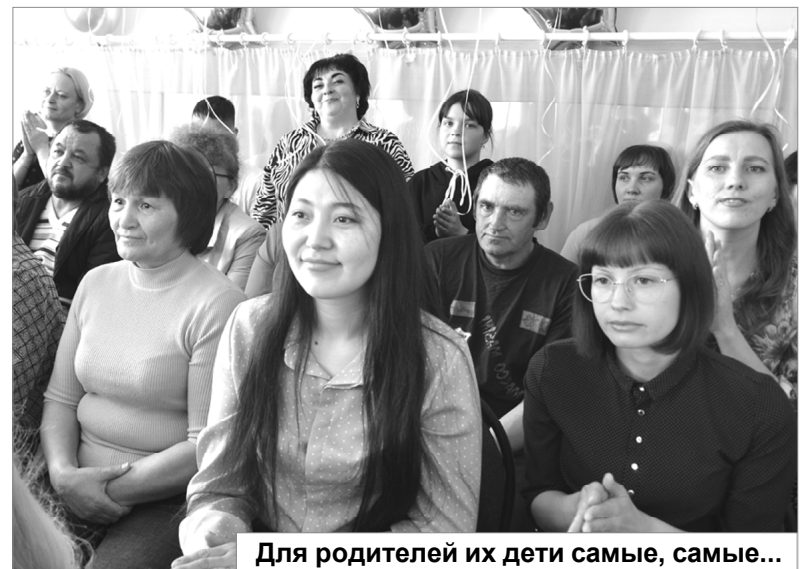
Для родителей их дети самые, самые...