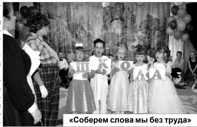
«Соберем слова мы без труда»