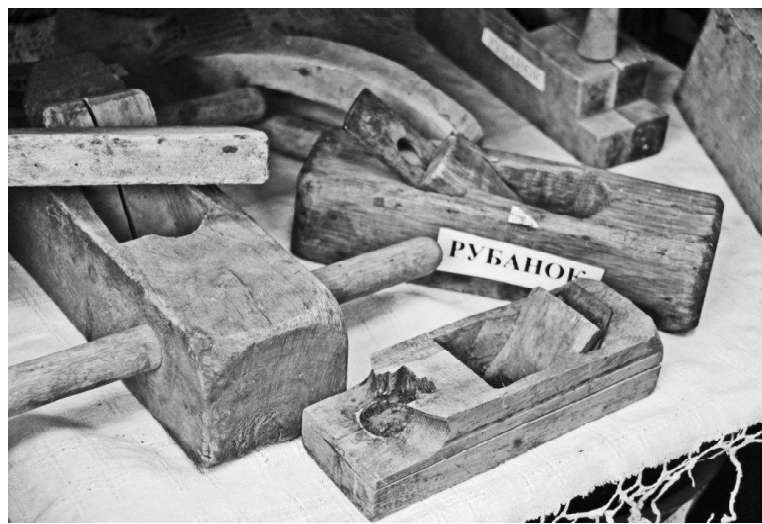
➤ Экспонаты Ермаковского музея