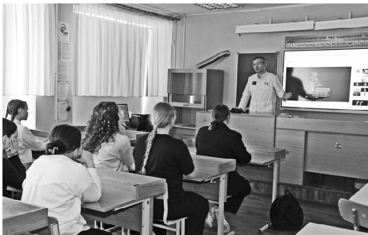
➤ Лекция по кардиологии