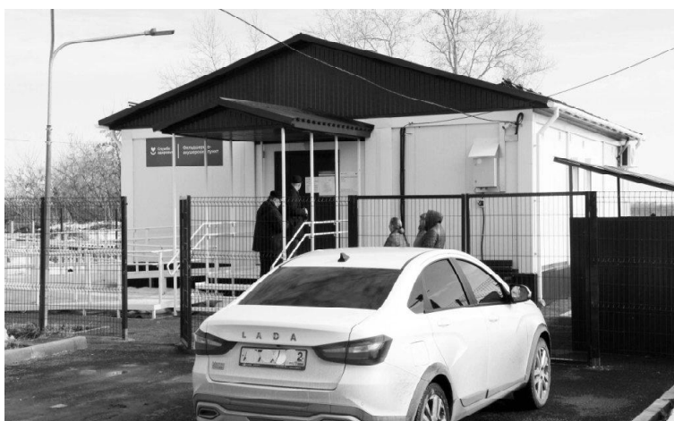
➤ ФАП в Балаганах

Очередной объект, который находится в Нововяткино, посетила народная комиссия в этот же день. Это угольная котельная. Мощность её 1,53 гигакалории в час. Котельная отапливает социальные объекты: школу, Дом культуры, интернат, детский сад, почту, МЧС, магазин. В 2021 году ООО ЖКХ «Викуловское» заключило трёхстороннее концессионное соглашение с администрацией района, и в рамках инвестиционной программы началась реконструкция угольной котельной. Провели проектные работы, экспертизу. Вначале планировали сделать небольшие работы, косметические, поменять всё оборудование на энергоэффективное. Но после экспертизы выяснилось, что