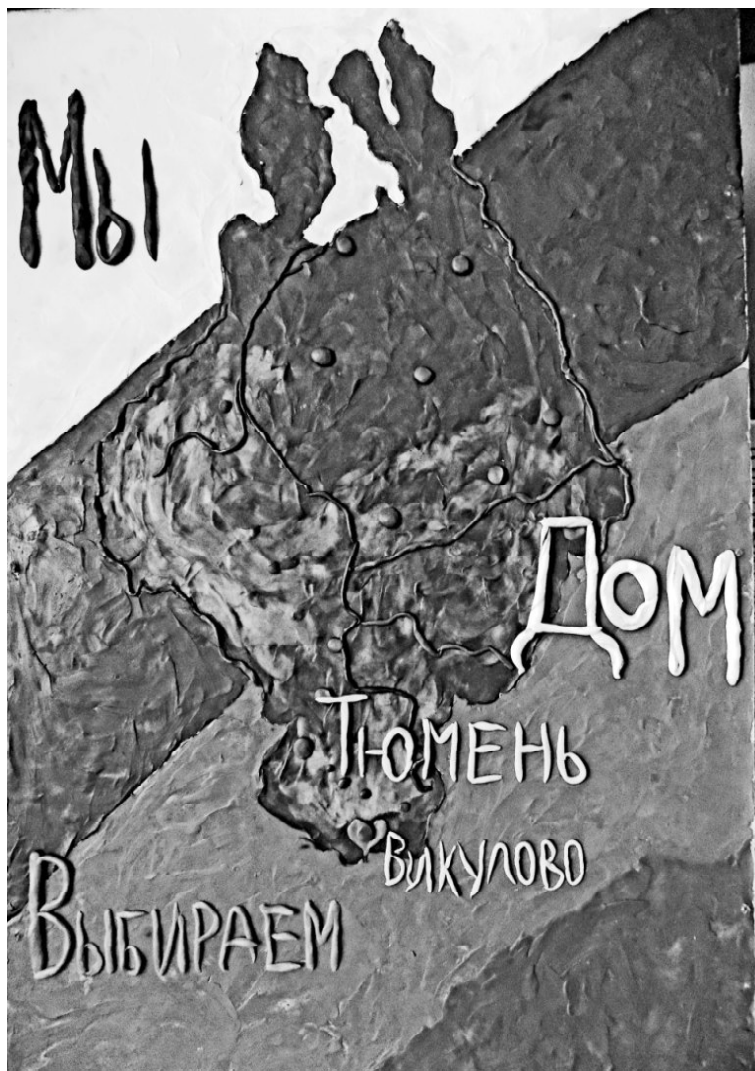
Эту картину из пластилина мы с парнями делали на областной конкурс и заняли 1 место