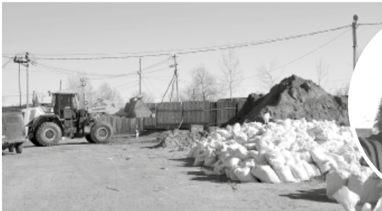
Герман Бабанин (фото автора)

Грунт для ликвидации технологических разрывов на дамбе завезён в полном объёме и даже с запасом. Да и большая часть работ уже выполнена с соблюдением технологий