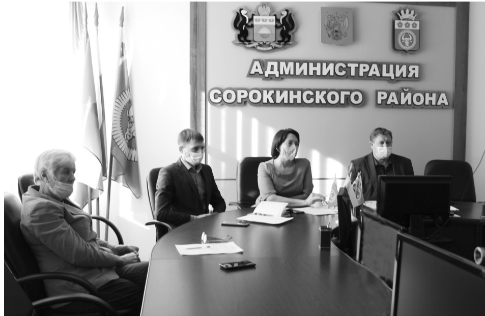
На снимке: участники заседания