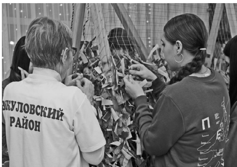
➤ Плетение сетей