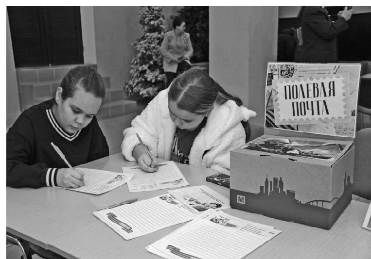
➤ Письма бойцам