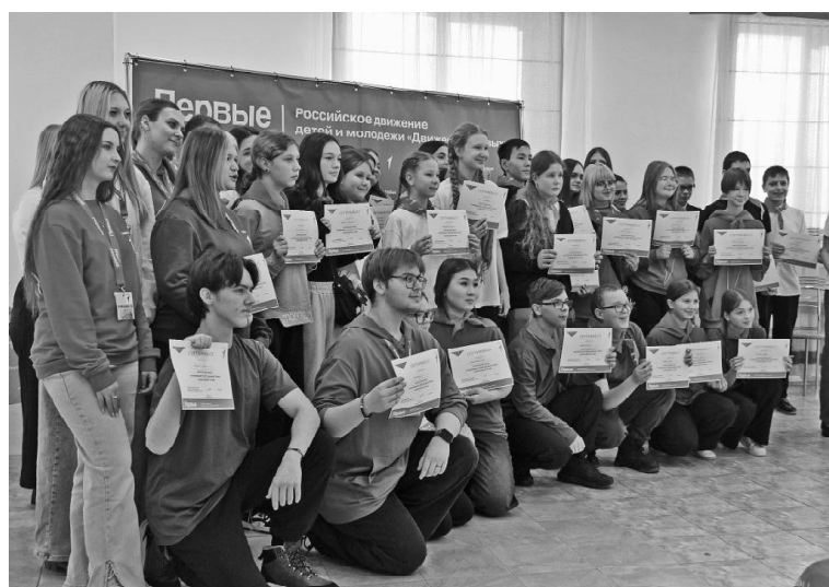
➤ Моменты встречи