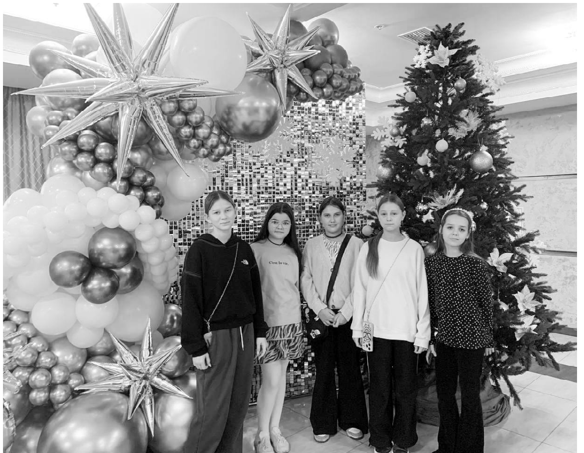
➤ Дети Викуловского округа на Губернаторской ёлке

Для ребят была организована расширенная программа, рассчитанная на два дня с заездом в оздоровительный детский центр «Ребёчья республика». Главный детский праздник состоялся 20 декабря во Дворце культуры «Нефтяник» города Тюмени и традиционно собрал более 900 талантливых детей со всех 26 муниципальных образований Тюменской области. Во Дворце культуры царил праздничная атмосфера. Детей встречали Дед Мороз, Снегурочка, Снеговик и