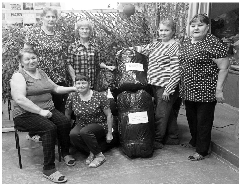
» Сартамские сетевязальщицы

Как только появилась необходимость в маскировочных сетях для наших воинов, участвующих в специальной военной операции по защите Донбасса, женщины Викуловского округа активно откликнулись на призыв. За многие месяцы они «набили руку» и набрались опыта. Теперь это дело поставлено на поток.