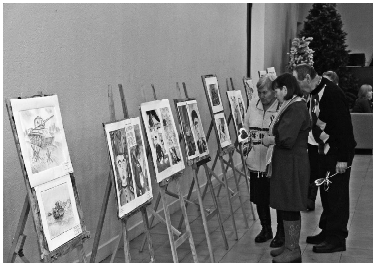
➤ Рисунки детей

19 декабря в РДК состоялось торжественное закрытие Года защитника Отечества и Года героев в Тюменской области. 2025 год был наполнен мероприятиями, посвящёнными памяти защитников Отечества разных поколений: нашим дедом и прадедам, вставшим на защиту Родины в годы Великой Отечественной войны, и бойцам, которые сейчас выполняют свой долг в зоне специальной военной операции.