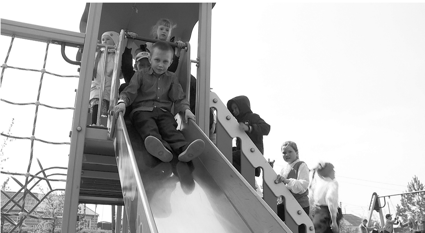
Прокатиться с ветерком с горки теперь можно и летом