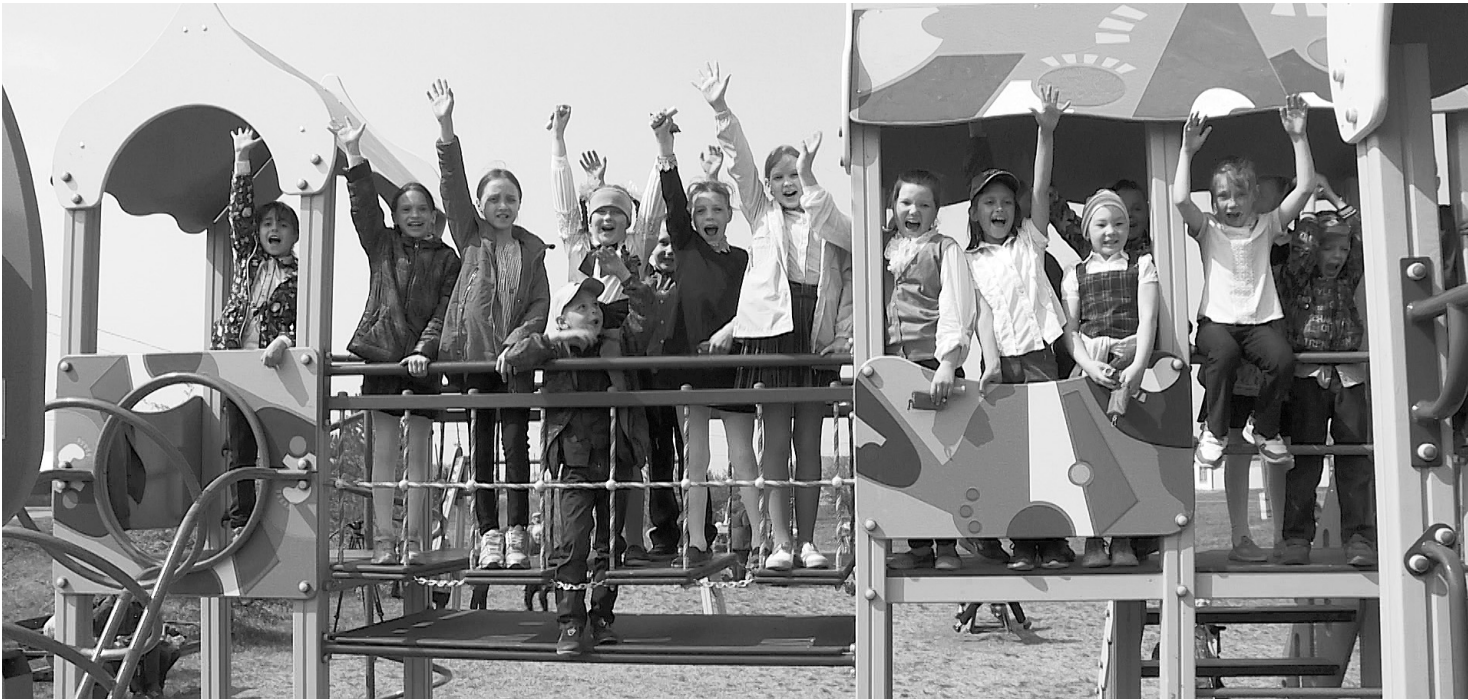
В учебные дни школьники прибежали поиграть на новую площадку после уроков. А летом здесь будут собираться отряды из лагеря