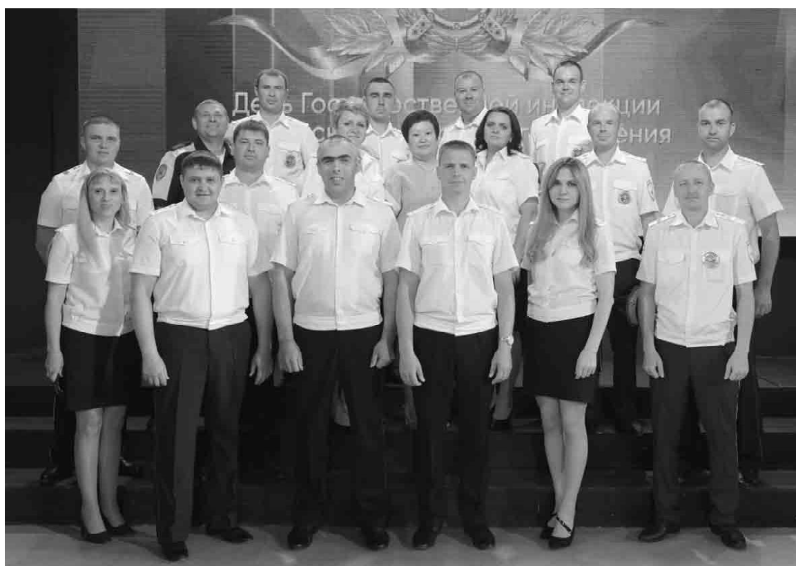
Празднование Дня образования Госавтоинспекции прошло в торжественной обстановке

В районном Доме культуры чествовали сотрудников ГИБДД