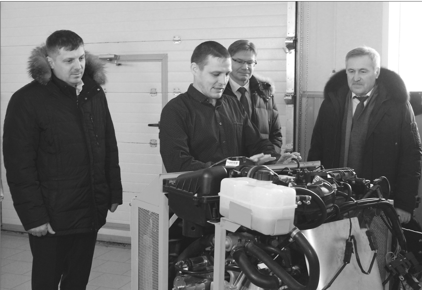
Депутаты Тюменской областной Думы оценили хорошую техническую оснащённость мастерских Голышмановского агропедколледжа