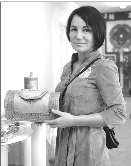
Берестяные сувениры от Светланы Синельниковой – изюминка Среднечирковского сельского поселения