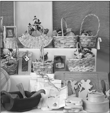
Изделия землянских ремесленников

С праздников и фестивалей домой всем хочется привезти не только красивую вещь, но и нужную в быту. О возможностях ремесленной мастерской и о том, как сделать свои сувениры продаваемыми, говорили на третьем семинаре «Истоки».