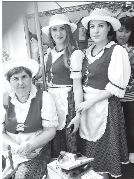
2019 год. На юбилее района