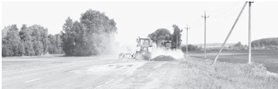
|| Ремонтируют дорогу на трассе Ялutorовск – Шадринск.

Также на территории Исетского обновляют дорожную разметку, в том числе линии пешеходного перехода для безопасности и удобства жителей села.