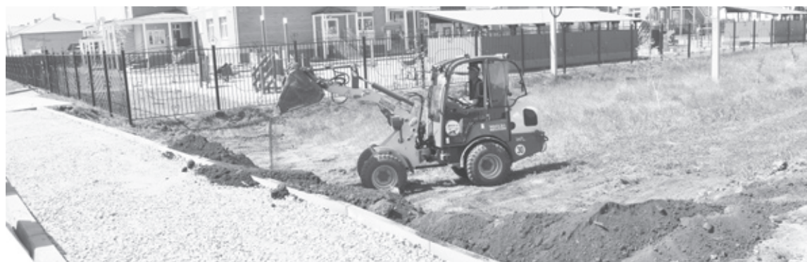
|| Около детского сада «Солнышко» в райцентре обустривают тротуар.