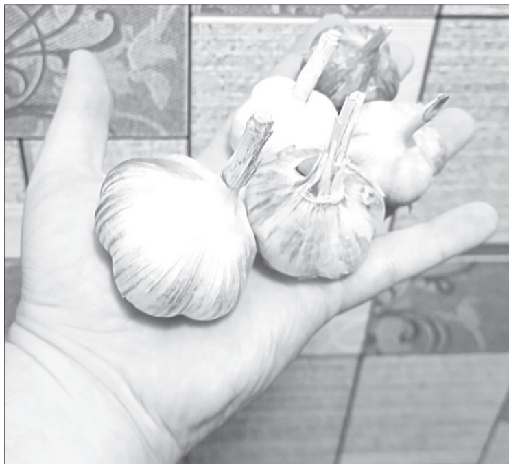
Многие огородники, лишь раз вырвав озимый чеснок, яровой уже не сажают

Подготовка почвы. Далее можно переходить к этому этапу. При перекопке желательно внести перегной из расчёта одно ведро на квадратный метр. Кроме того, рекомендуется применять и просеянную древесную золу, чтобы раскислить грунт и пополнить в нём запасы калия. Дело в том, что чеснок и лук не любят кислых почв, для них предпочтительна слабокислая или нейтральная реакция среды.