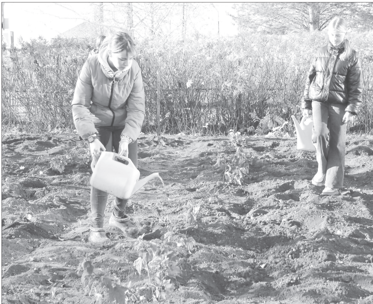
Карабашские старшеклассницы, как любые сельские школьники, привыкли к труду на земле, но всех тонкостей ухода за смородиной пока не изучили