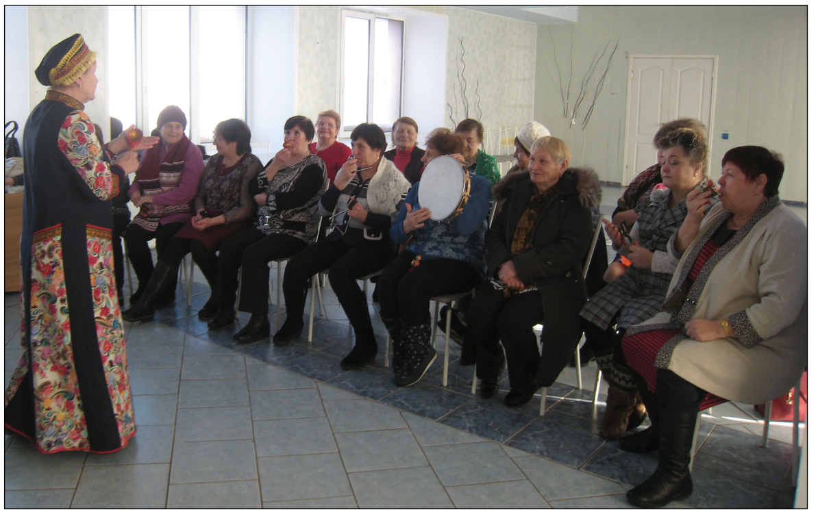
◆ Занятия на народных музыкальных инструментах увлекло всех присутствующих.