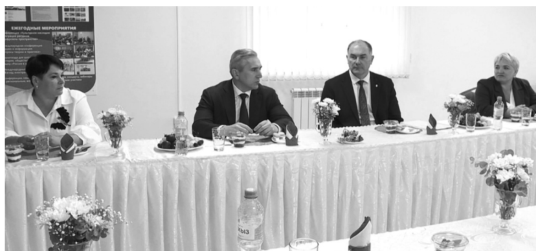
Участники встречи поблагодарили Александра Моора за помощь семьям мобилизованных

Члены семей мобилизованных спросили у губернатора, когда их мужья и сыновья вернутся домой после окончания СВО, на какие дополнительные меры поддержки они могут рассчиты-