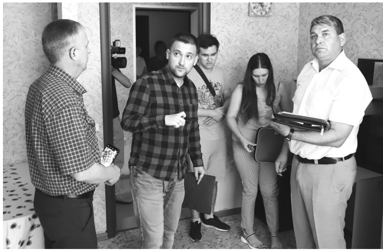
Члены межведомственной комиссии побеседовали с каждым владельцем квартиры в доме