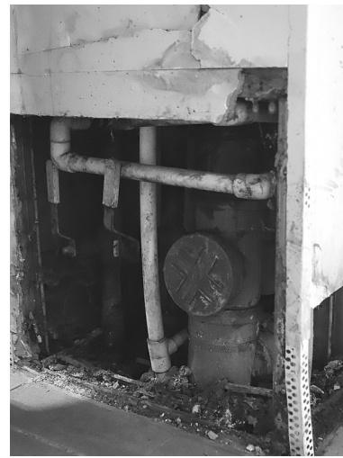
Разрушенные стены в подвале обнажили все коммуникации

непригодными, что приводит к авариям. За свой счёт жители этого дома отказываются ремонтировать коммуникации и квартиры, потому что не являются соб-