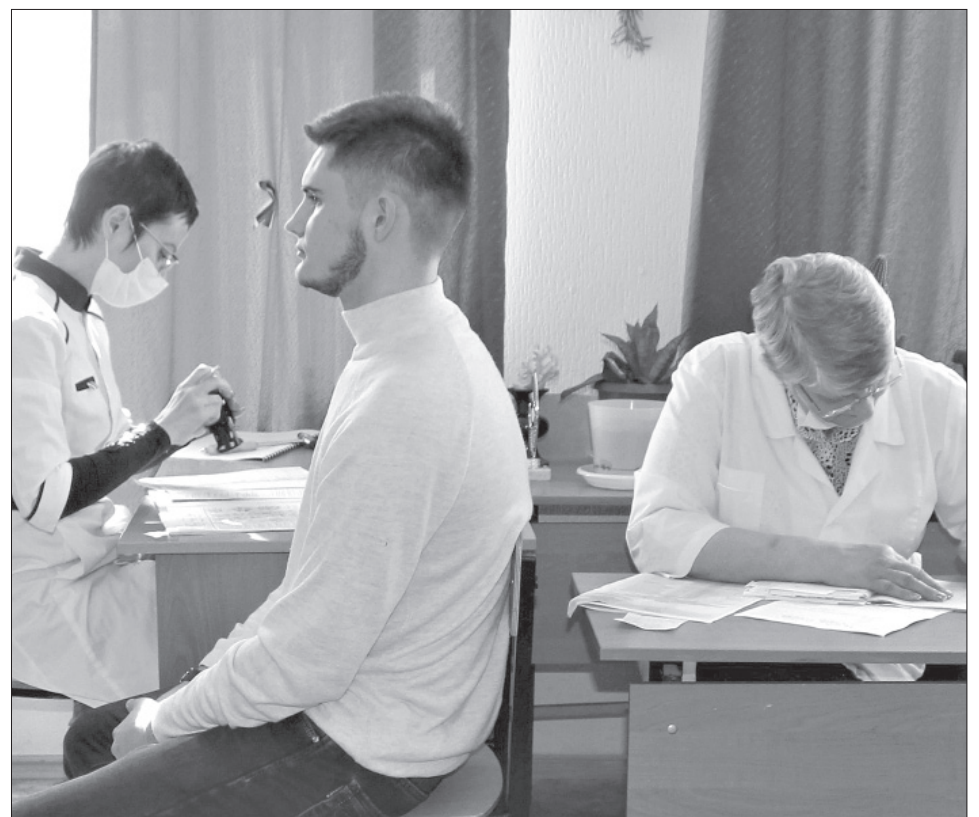
В нашем муниципалитете состоялась военно-врачебная комиссия.

– Традиционно медицинский осмотр призывников состоялся в помещении ДДТ «Галактика». Приём провели специалисты ГБУЗ ТО «Областная больница № 14» им. В.Н.Шанаурина (с.Казанское). Был организован подвоз из населённых пунктов к месту проведения мероприятия. Поставленную задачу по комплектованию Вооружённых сил РФ молодым пополнением совместно с военным комиссариатом мы выполним. Наши земляки ежегодно показывают хорошие результаты, достойно выполняют свой гражданский долг во время срочной службы, – говорит заместитель гла-