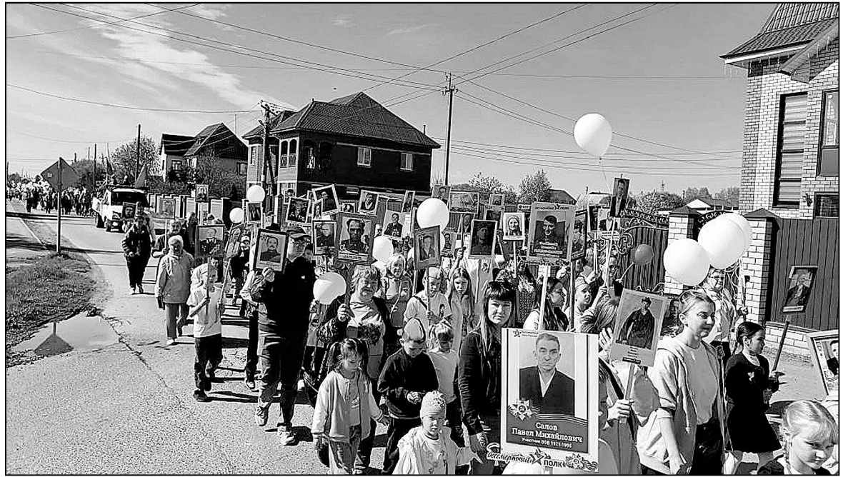
«Бессмертный полк» в Пышминском территориальном управлении.

В основу сценария торжественного мероприятия, проходившего в большом зале «Родника», легли публикации из газеты «Крас-