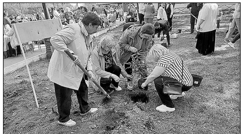
В Онохино вырастет «Сад памяти».