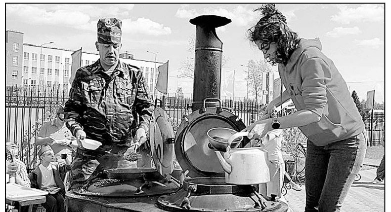
Солдатская каша в Винзилях.