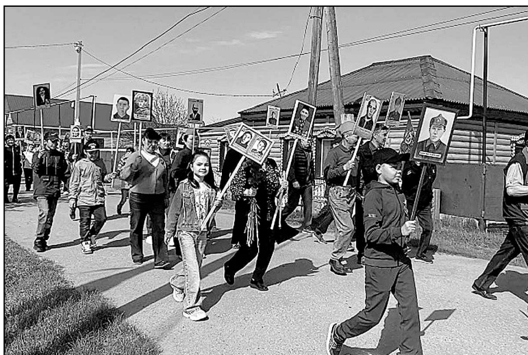
В Андреевском чтят память дедов и прадедов.