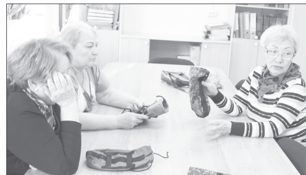
В акции активно участвуют представительницы землячества «Север»

Волонтеры заказали необходимые материалы. Как только посылка придёт, городские добровольцы приступят к созданию наборов. В комплект войдут вырезанные из плотной ткани детали изделия, отрезки текстильных строп и шнуры. Подклю-