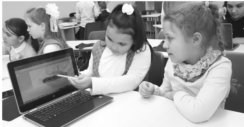
Техническое задание получили школьники на уроке технологии – создать высокоскоростное космическое такси. Фантазия не подвела

га «Точки роста» изучаются программы дополнительного образования по IT-технологиям, медиа-творчеству, шахматному образованию, проектной деятельности. Тут же организуются деловые игры и тренинги. Словом, всё, что помогает совершенствовать креативность, пространственное и аналитическое мышление – не только у детей, но и педагогов и родителей.