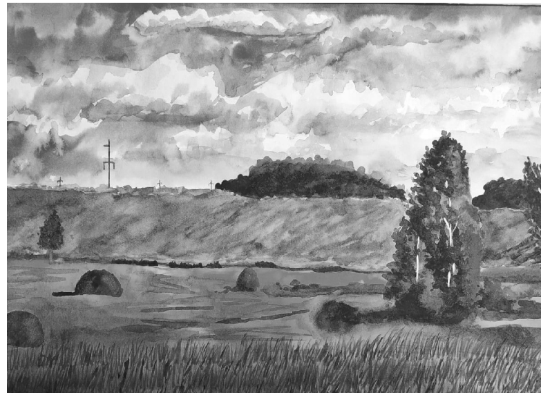
«Травы скошены» – рисунок Анастасии Хомец, 13 лет

Любовь АЛЕКСЕЕВА