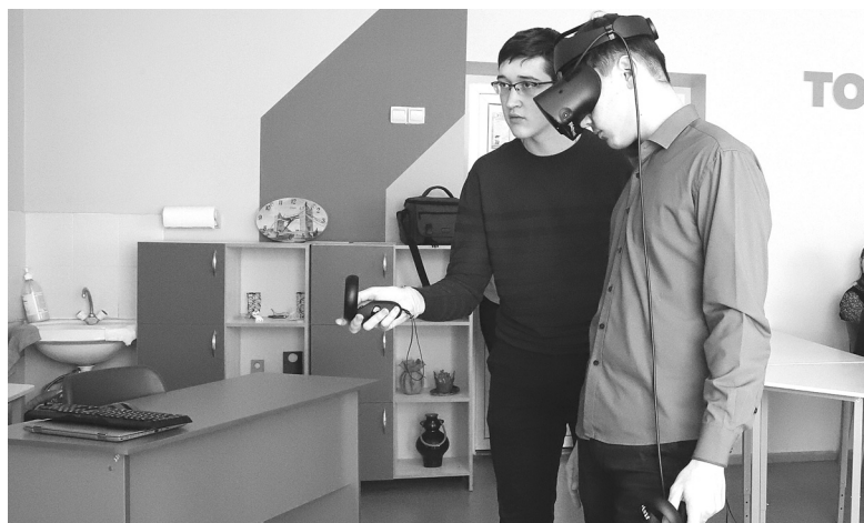
На уроке ОБЖ старшеклассники школы № 2 отработывают навыки поведения при антитеррористической угрозе, используя VR-очки и виртуальные сценарии