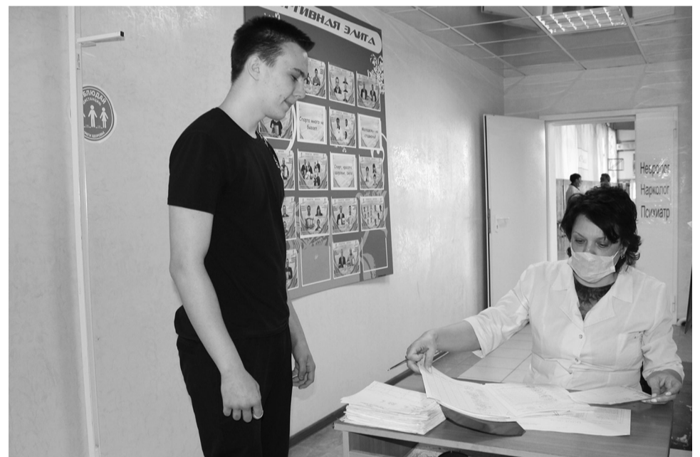
Медицинское освидетельствование призывников проходит в сложной санитарно-эпидемиологической обстановке

В связи с этим для медицинского освидетельствования были вызваны только 50% призывников от числа вызываемых на призывную комиссию. Это годные к военной службе, подлежащие призыву и отправке в войска; временно не годные к военной службе по состоянию здоровья, в том числе отказавшиеся от реализации своего права на отсрочку или освобождение от призыва.