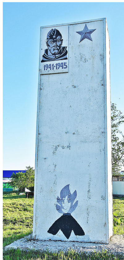
Так выглядит старый памятник, установленный в 1972 году