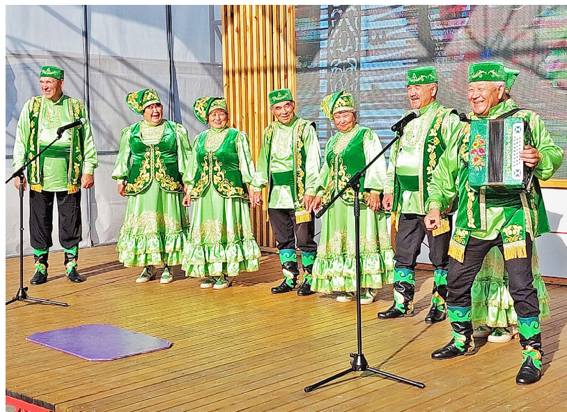
На празднике мастеров

– мастерам, ищущим новую аудиторию для продажи своих изделий, или коллег для общих проектов;