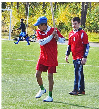
Игра в лапту требует умений и ловкости

Текст и фото департамента физической культуры, спорта и дополнительного образования Тюменской области