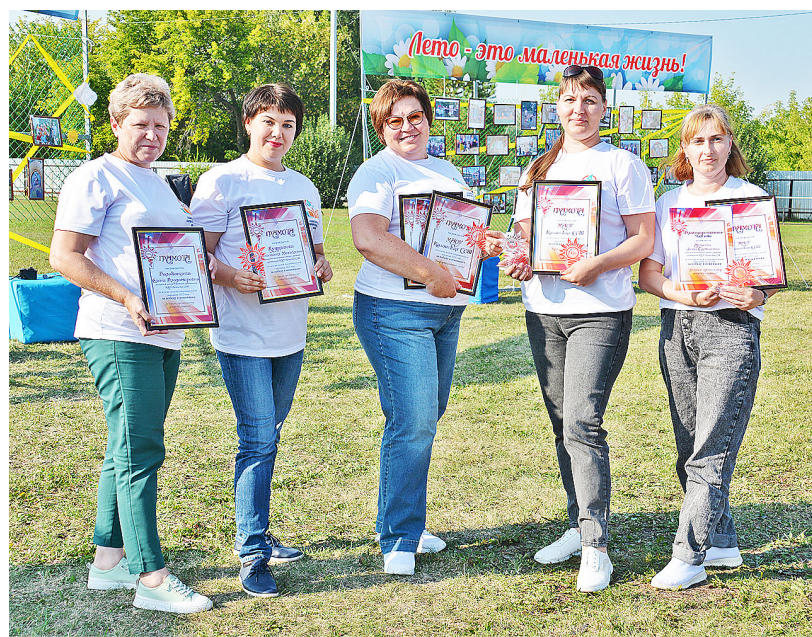
У педагогов Казанской школы множество грамот

Каждый лагерь работал по особой программе. Все они были связаны с изучением национальных культур жителей России и отдельно взятого Казанского района. Ребята познакомились с бытом, традициями и наследием казахов, татар, немцев, белорусов, украинцев и других национальностей. Итогом летнего сезона стало проведение в