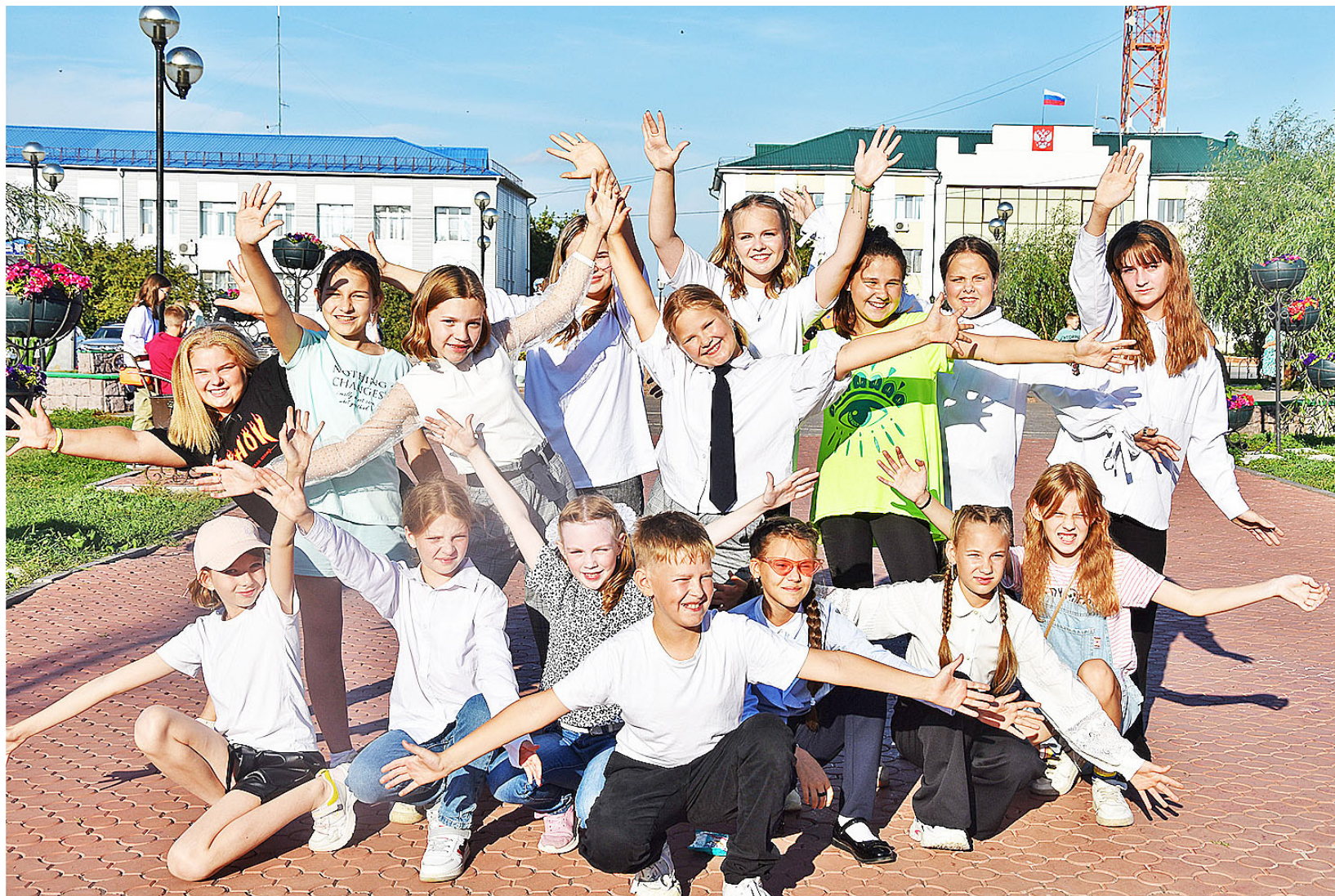
С хорошим настроением школьники встретили первый день осени

В центральном парке состоялся праздник, посвящённый началу учебного года