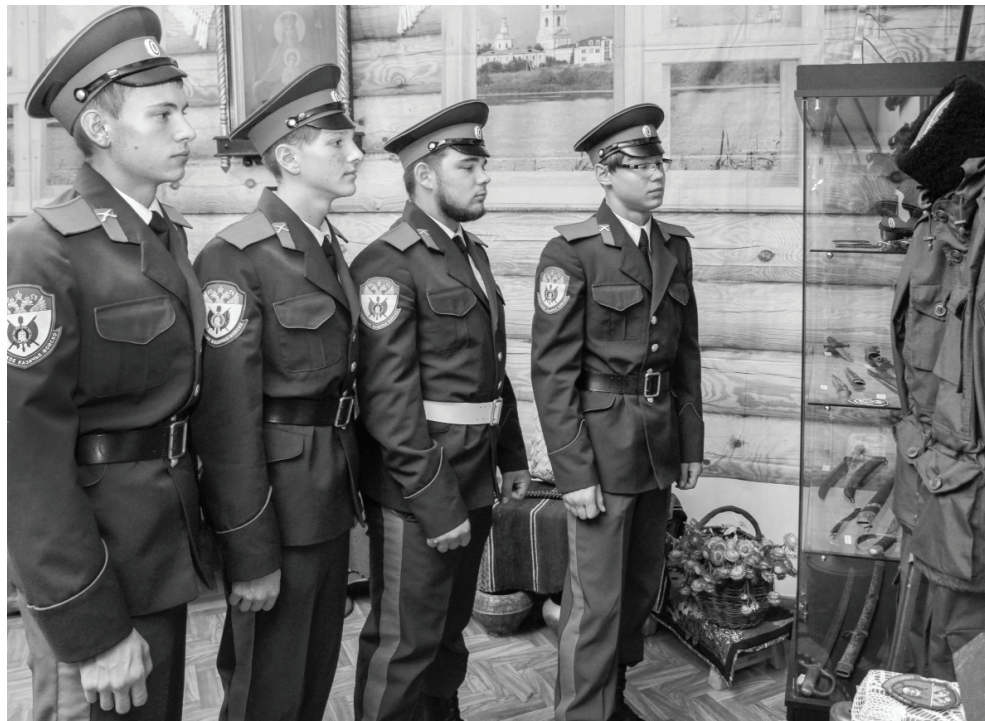
Первые посетители выставки – воспитанники казачьих классов.

– В центре композиции – Державная икона Божией Матери, подаренная Ишимскому казачьему обществу казаки выезжают на смотрины, слёты и конкурсы. И результат не заставил себя ждать – в этом году ишимцы привезли