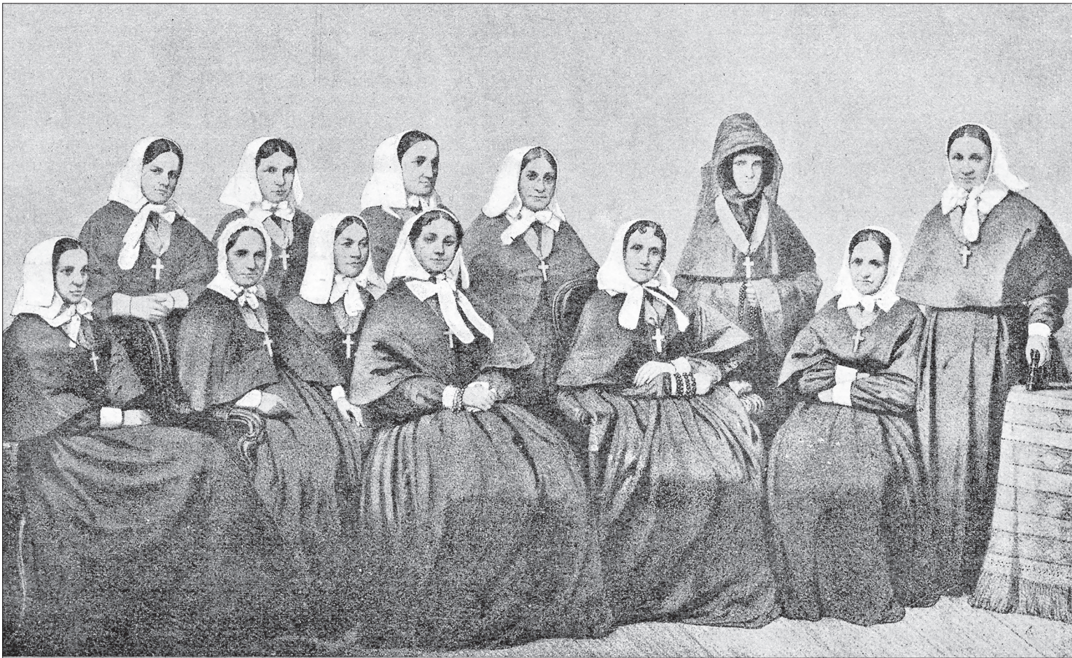
1855г. Сёстры крестовоздвиженской общины.

Общество Красного Креста отметило большой юбилей