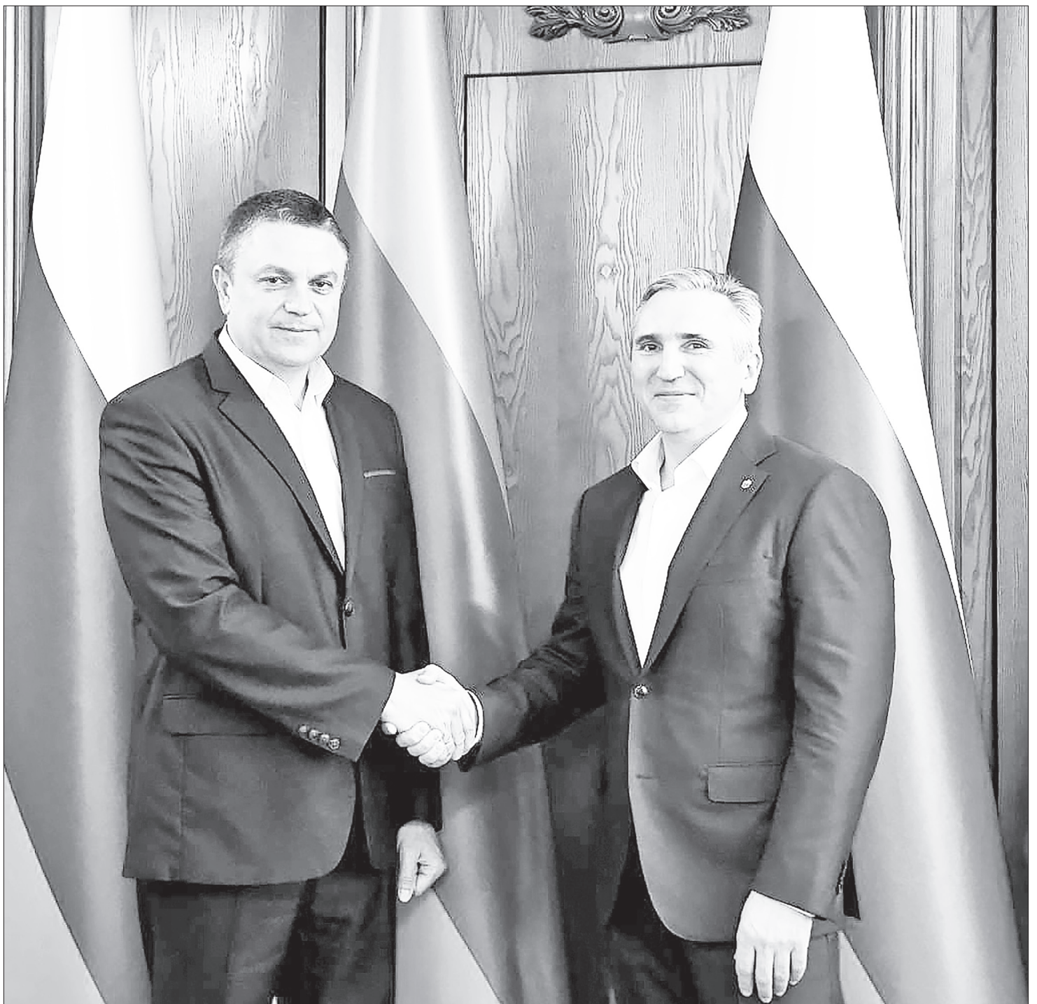
■ Губернатор Тюменской области Александр Моор и глава Луганской народной республики Леонид Пасечник обсудили дальнейшие шаги сотрудничества.

Также глава региона встретился с Леонидом Пасечником, главой Луганской народной республики. Последний заявил, что жители выступают за вхождение в состав Российской Федерации и сделали свой выбор ещё в 2014 году.