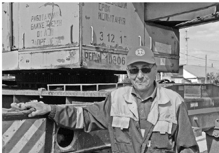
➤ Владимир Васильев