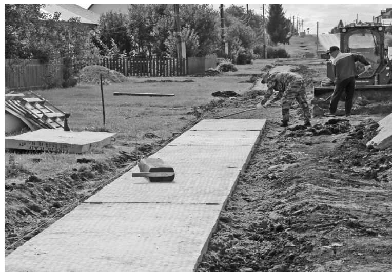
➤ Строительство тротуара на ул. Гагарина

все выравнивают подушку под железобетонной плитой, подсыпают песок, на глаз