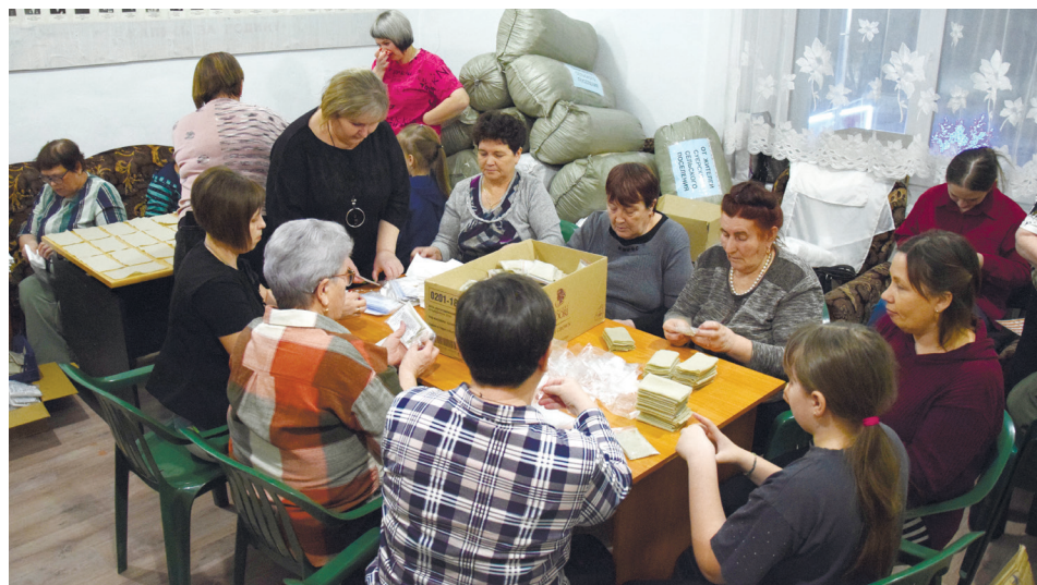
Участницы клуба регулярно встречаются для сбора и изготовления гуманитарной помощи.