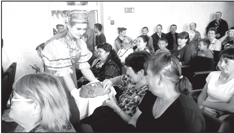
Хлебом-солью встречали односельчан и почётных гостей на празднике в Зонове