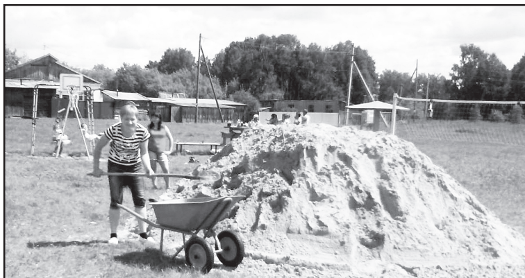
Оборудование детской площадки

То, что здешние травницы несли в себе целительную энергию, это никто не оспаривал. Энергию добра. И денег за лечение не