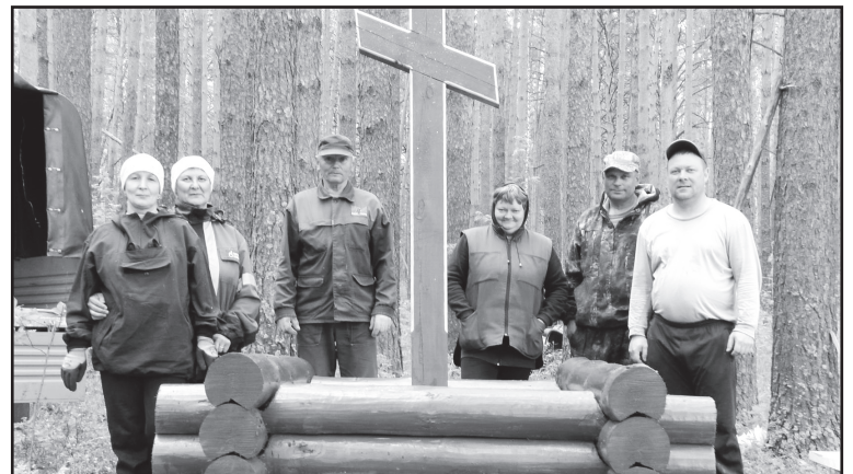
Заозёрцы пережили духовный подъём

брали – что могут люди дать, яйца, мёд, овощи, хлеб, тому и рады были.