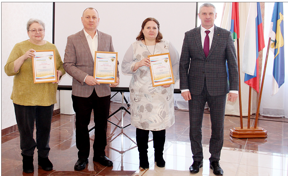
• По итоговым результатам оценки всех показателей дипломом за первое место награждена Слободчиковская сельская территория, второе – Юрминская, третье – Кротовская.