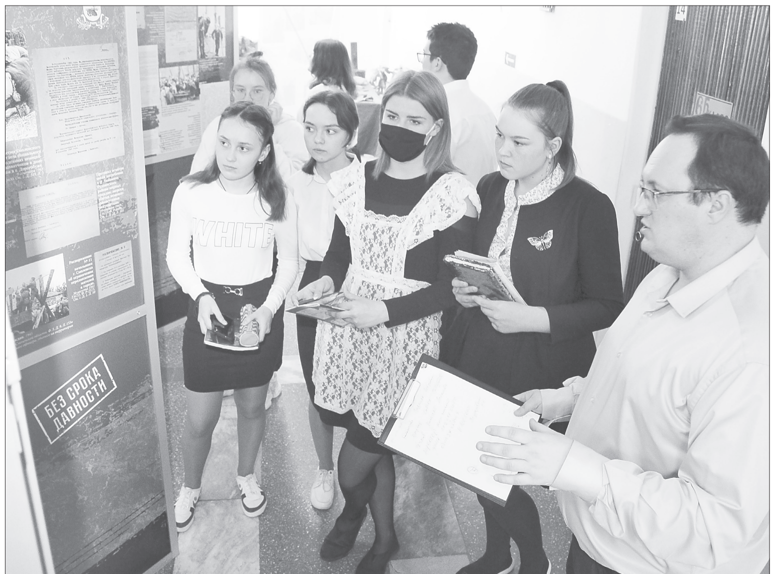
Экспозиция служит для старшеклассников района наглядным пособием на уроках истории