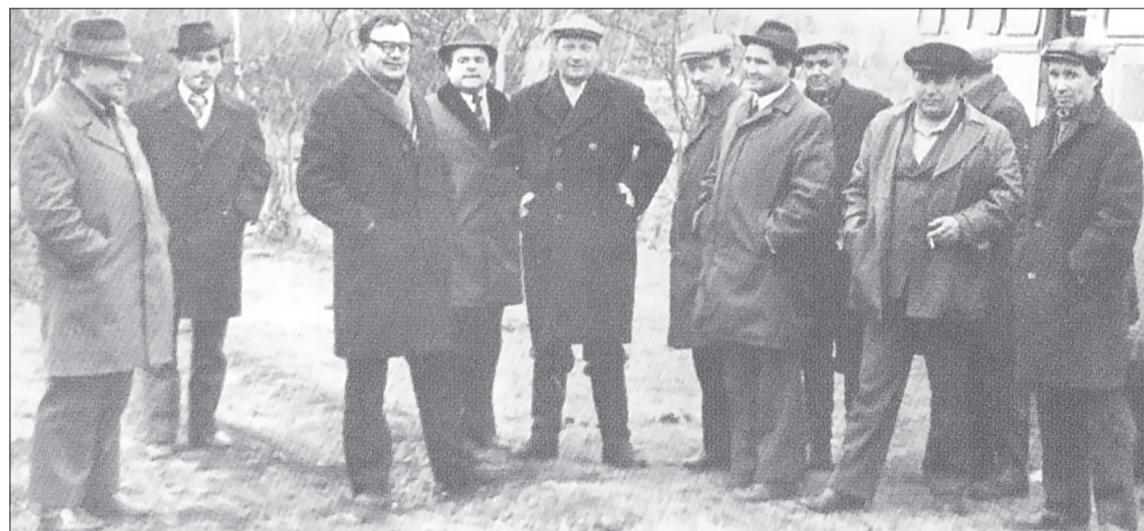
Директорский корпус хозяйств района на взаимопроверке (1970-е годы)