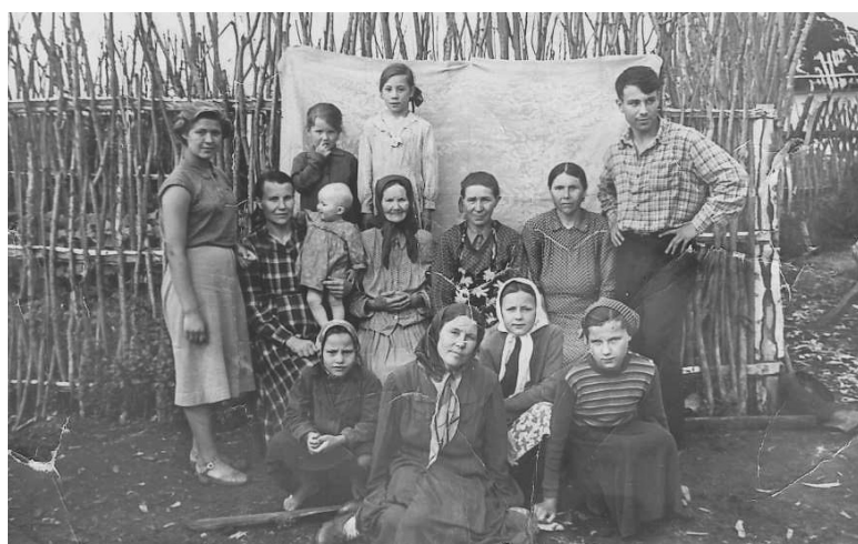
Популярный забор-«огуречник» служил не только хозяйственным ограждением, но и колоритным фоном для фотографий

чан мы с мужем тоже обзавелись хозяйством. Обрабатывали с ним огород – 25 соток, выращивали свиней, кур и пуховых коз. Зимними вечерами я вязала вещи для семьи, а летом свободное время уходило на заготовки. Бегали в лес по грибы и ягоды, потом всё перерабатывали.