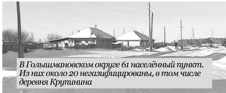
В Голышмановском округе 61 населённый пункт. Из них около 20 негасифицированы, в том числе деревня Крупинина

Дорога в деревню Крупинина Гладиловской сельской территории начинается с густого соснового леса и идеального асфальта до поворота с автотрассы