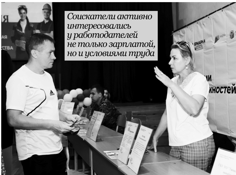
Соискатели активно интересовались у работодателей не только зарплатой, но и условиями труда

В округе прошёл федеральный этап Всероссийской ярмарки трудоустройства