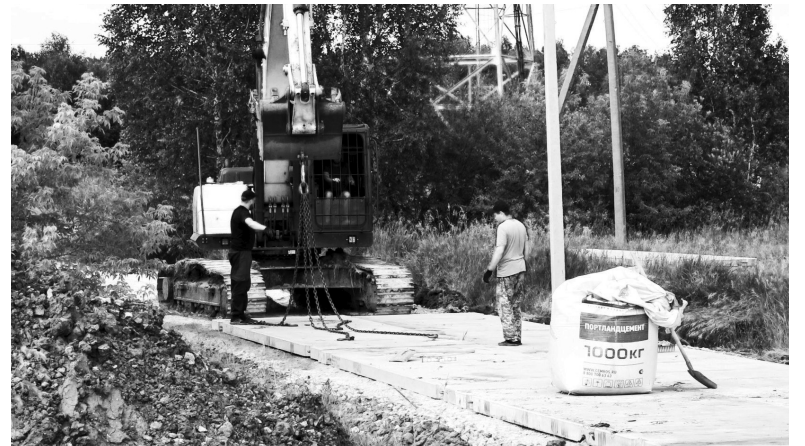
Дорожники укладывают бетонные плиты на ремонтируемом участке на улице Полевой посёлка Голышманово

Наталья ГЛАДКОВСКАЯ