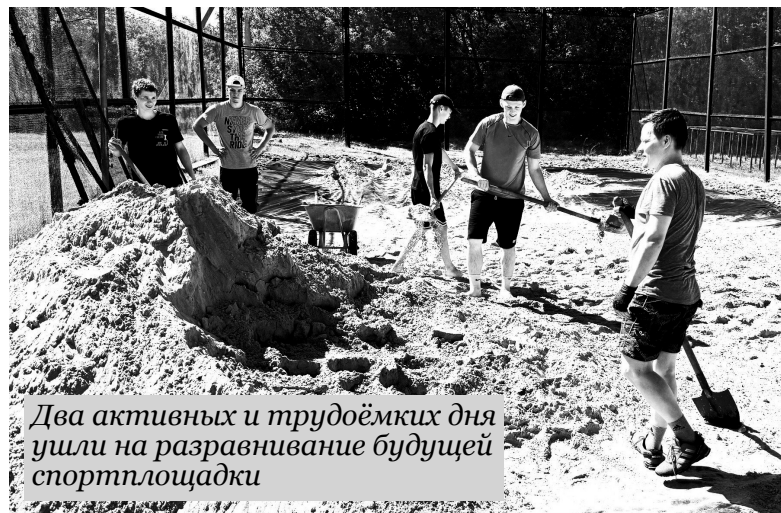
Два активных и трудоёмких дня ушли на разравнивание будущей спортплощадки

На выбранном участке активная молодёжь взялась за обустройство спортплощадки. Вспахали землю, закрыли её изоляционной плёнкой, сверху засыпали песком и установили сетку.