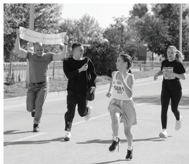
Никто не сошел с дистанции – до финиша добежали все!

Во Всероссийском дне бега, который прошел 16 сентября, приняли участие более трех с половиной тысяч человек.