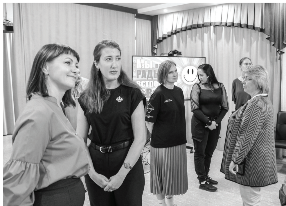
Лекции и практикумы проходили на базе центра «Согласие» в рамках проекта «Кафе «Диалог» АНО «Вектор развития» г. Ишима.

В 2023 году в Ишиме зарегистрировано более 100 некоммерческих организаций, которые успешно реализуют