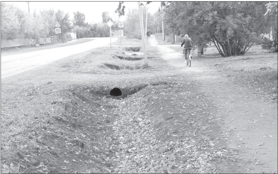
Кюветы чистят и углубляют в местах выхода воды на тротуар

Председатель комитета напомнил, что в правилах благоустройства чётко прописано: содержать водопропускные трубы в рабочем состоянии - обязанность домовладельцев. Но городские власти периодически следуют системе водоотведения и, если есть необходимость, принимают меры. В этом году на ул. Советской уже выявлены два подтопленных участка. Следующей весной специалисты заглянут и по адресу дозвонившейся горожанки и, если будет необходимо, запланируют работы.